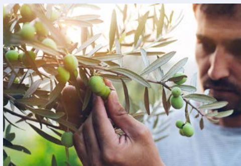
Willkommen auf Zypern