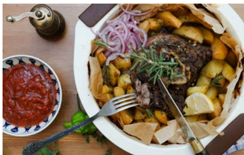
Kleftiko – ein landestypischer Lammbraten

Heute verabschieden Sie sich von Zypern und fliegen mit neu gewonnenen Eindrücken wieder zurück nach Deutschland. (F)