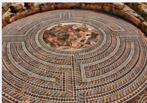
Römische Villen in Paphos: Fußboden-Mosaik