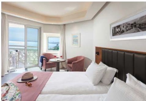
Zimmerbeispiel – Standard Zimmer mit seitlichem Meerblick

Das Hotel St. Raphael Resort & Marina (Landeskategorie: 5 Sterne) in Limassol ist unmittelbar am feinen Sandstrand gelegen. Sämtliche Zimmer verfügen über Balkon oder Terrasse. Zu den Mahlzeiten stehen auf der weitläufigen Anlage mehrere Restaurants zur Auswahl, überdies finden sich auf dem Gelände einige Bars und ein Lobby-Café. Neben zwei Frischwasser-Außenpools lädt ein Spa mit Sauna zum Entspannen ein. Daneben verfügt das Hotel auch über zwei Tennisplätze.