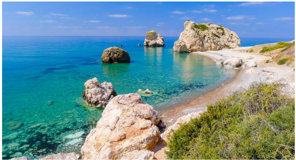
Felsen der Aphrodite