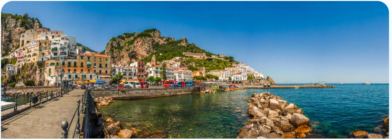
Zauberhafte Ausblicke auf Amalfi