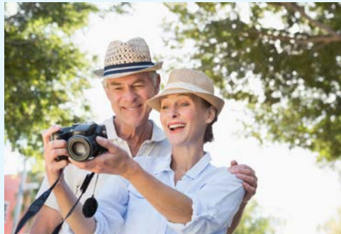
Unterwegs auf Entdeckungstour