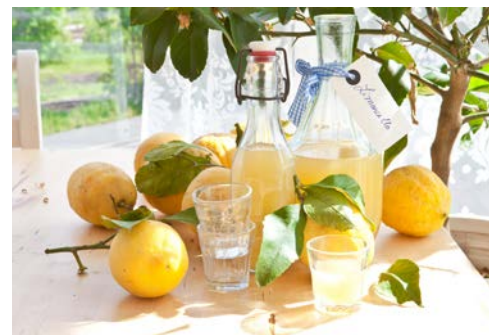
Limoncello – einfach köstlich

Flugplan-, Hotel- und Programmänderungen vorbehalten. An- und Abreisetag dienen ausschließlich der Erbringung der vertraglichen Beförderungsleistungen. Je nach Fluggesellschaft und Flugdauer werden Bordverpflegung und Getränke nur gegen Bezahlung angeboten. Stand 08/20 – alle Angaben ohne Gewähr.