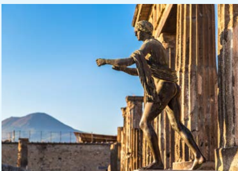
Die antike Stadt Pompeji

Am Vormittag besichtigen Sie Pompeji. 20 km südlich von Neapel am Fuße des Vesuvus liegt die antike Stadt, die im Jahre 79 n. Chr. durch den Ausbruch des Vulkans verschüttet wurde. Konserviert durch meterhohe Ascheberge präsentiert sich Pompeji heute als eine der besterhaltensten Städte der Antike. Lassen Sie sich während der ausführlichen Besichtigung der Ausgrabungen in die Lebensweise der alten Römer einweihen. Im Anschluss besuchen Sie eine Limoncello Fabrik. Von der Panoramaterrasse des Hauses, kurz vor Positano, genießen Sie einen atemberaubenden Blick über die einzigartige Küste. Bei einer Verkostung können Sie das köstliche „Nationalgetränk“ der Region probieren. Im Anschluss erfolgt die Weiterfahrt nach Sorrent. Während einer Stadtbesichtigung