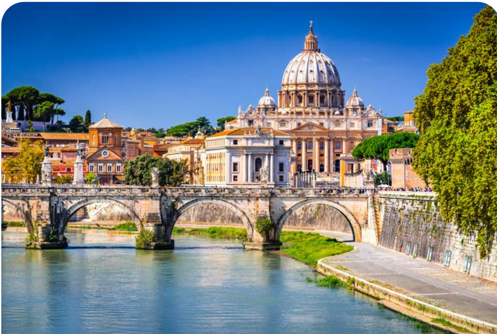
Die Engelsbrücke in Rom