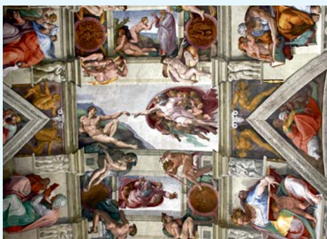
Sixtinische Kapelle – faszinierend

Auf der Piazza Colonna sehen Sie die herrliche Säule des Marc Aurel, auf der Piazza di Pietra die Ruinen des Hadriantempels. Schließlich gelangen Sie zum besterhaltenen Bauwerk des antiken Roms, dem Pantheon, dessen Grundstein aus dem Jahre 27 n. Chr. datiert. Noch heute gilt der Kuppelbau als Musterbeispiel altrömischer Baukunst. Anschließend begeben Sie sich zur wunderschönen Piazza Navona mit der reich dekorierten Barockkirche Sant Agnese in Agone. Hier steht der berühmte Brunnen von Bernini „Fontana dei quattro Fiumi“, der die Flüsse Donau, Nil, Ganges und Rio de la Plata symbolisiert. Nutzen Sie den Nachmittag für einen entspannten Cappuccino in einem der zahlreichen Straßencafés oder lassen Sie sich durch das quirlige Rom treiben.