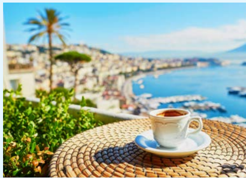
Genießen Sie „la dolce vita“