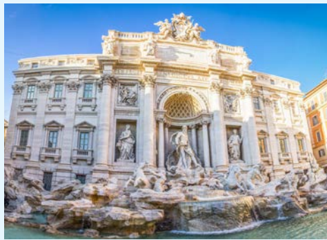
Der Münzwurf am Trevibrunnen – ein Muss!

Am Vormittag können Sie die romantische Seite von Rom kennenlernen. Auf der breiten „Spanischen Treppe“ an der Piazza di Spagna herrscht stets Hochbetrieb. Wer Rom wiedersehen will,