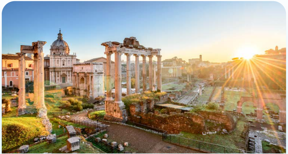
Forum Romanum in Rom

„La Dolce Vita“ – schon Johann Wolfgang von Goethe wusste seit seiner Italienreise im Jahr 1786 die italienische Lebensart, das milde Klima und die Kunstschätze Roms zu schätzen. Entdecken Sie die „ewige Stadt“ und ihre 3.000-jährige Geschichte und lassen Sie sich von der Fülle an Sehenswürdigkeiten verzaubern: Petersdom, Vatikan mit Sixtinischer Kapelle, Forum Romanum, Kolosseum... Im zweiten Teil Ihrer Reise erkunden Sie die antike Stadt Pompeji, kosten von dem leckeren Limoncello, dem „Nationalgetränk“ der Region Kampanien, und entdecken die malerische Region rund um Sorrent. Auf einem optionalen Ausflug können Sie außerdem die Schönheit der weltbekannten Amalfiküste entdecken.