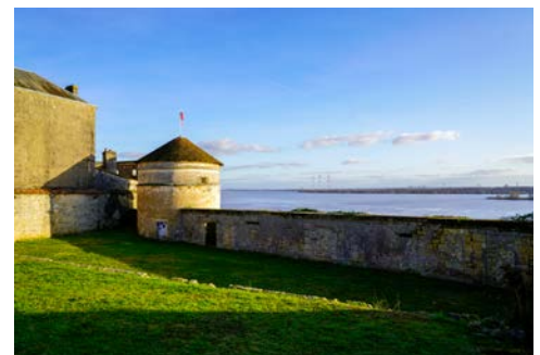
Blick von Bourg auf den Fluss

Die CYRANO DE BERGERAC verlässt am Morgen Pauillac/Cussac und erreicht nach kurzer Fahrt Blaye. Hier gehen Sie nach dem Frühstück von Bord und starten zu einer Rundfahrt auf der Corniche Girondine nach Bourg, die im Volksmund „Route des Capitaines“ genannt wird. Die landschaftlich beeindruckende Strecke entlang der Kalkfelsen bietet immer wieder schöne Ausblicke auf die Gironde. Kurzer Aufenthalt in dem von Römern gegründeten Ort Bourg. Zurück in Blaye besichtigen Sie die von Vauban errichtete imposante Zitadelle. Die Ausmaße der Zitadelle sind überwältigend, tatsächlich beherbergt sie eine Stadt für sich, in der man Gaststätten, Kunsthandwerkergärten und weite Rasenflächen findet. Zum Mittagessen kommen Sie zurück an Bord. Genießen Sie am Nachmittag die gemütliche Fahrt auf der Gironde bis zur Mündung in den Atlantik und wieder flussaufwärts zurück nach Blaye. Abendessen an Bord.