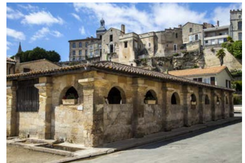
Blaye an der Gironde

Anreise nach Bordeaux, Transfer zum Anleger an der Gironde, wo die CYRANO DE BERGERAC zur Einschiffung bereit liegt. Nach dem Kabinenbezug lernen Sie bei einem Begrüßungsdrink die Mannschaft kennen und nehmen danach Platz im Schiffsrestaurant zu Ihrem ersten Dinner an Bord.