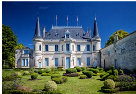
Chateau Palmer und Margaux.