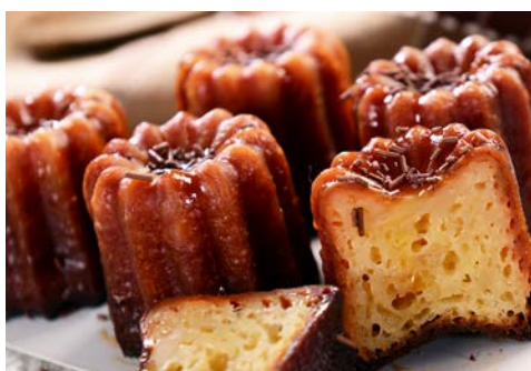
Canelés sind ein typisches Dessert der Region