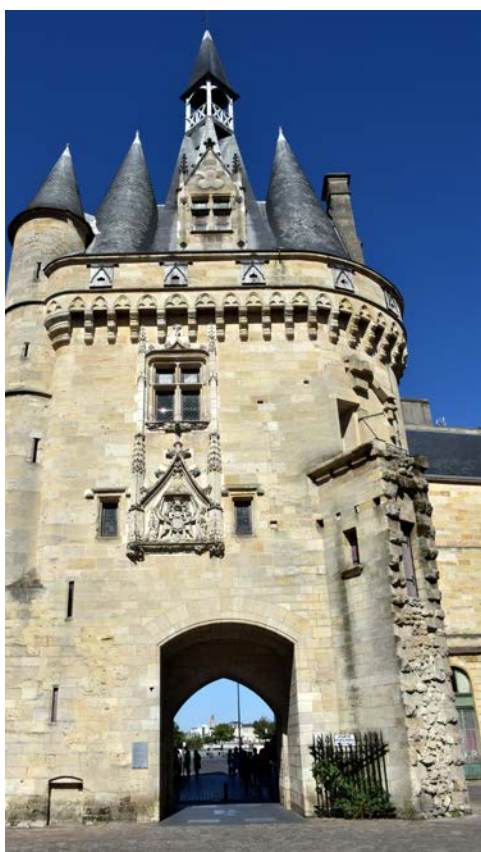
La Porte Cailhau in der Altstadt von Bordeaux

Am Morgen starten Sie Ihre Kreuzfahrt flussabwärts Richtung Dordogne. Nach dem Mittagessen beginnen Sie Ihren Ausflug nach St. Emilion, das mit seinen Weinhängen, die das Städtchen wie ein Schmuckkästchen umgeben, zum Weltkulturerbe der UNESCO zählt. Sie schlendern durch die malerischen Gässchen des hübschen Städtchens, in dessen Geschäften nicht nur Wein, sondern auch die köstlichen Macarons zum Kauf angeboten werden. Dann entdecken Sie das unterirdische Kulturerbe: in der Monolithkirche steigen Sie zu den geheimnisvollen Katakomben und Stollen hinunter, deren Gesamtlänge auf über 100 km geschätzt wird. Nach der Besichtigung fahren Sie durch das Weinanbauggebiet des Pomerol zurück nach Bourg, wo Sie zum Abendessen wieder an Bord der CYRANO DE BERGERAC gehen.