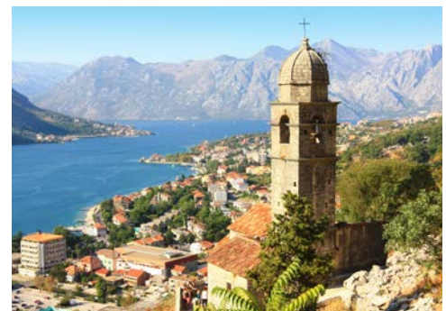
Kotor im Kotor-Fjord

Wie herrlich Ihre Schiffsreise mit einem entspannten Seetage zu beginnen. Erkunden Sie in aller Ruhe Ihr Schiff!