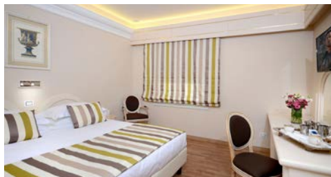
Zimmerbeispiel Ihres Hotels