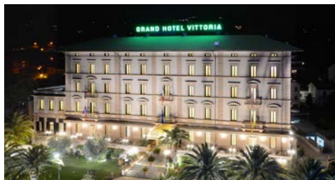
Das Grand Hotel Vittoria

Im Hotel erhalten Sie ein erweitertes Frühstück und zum Abendessen gibt es ein 3-Gang Menü mit Wahlmöglichkeit.