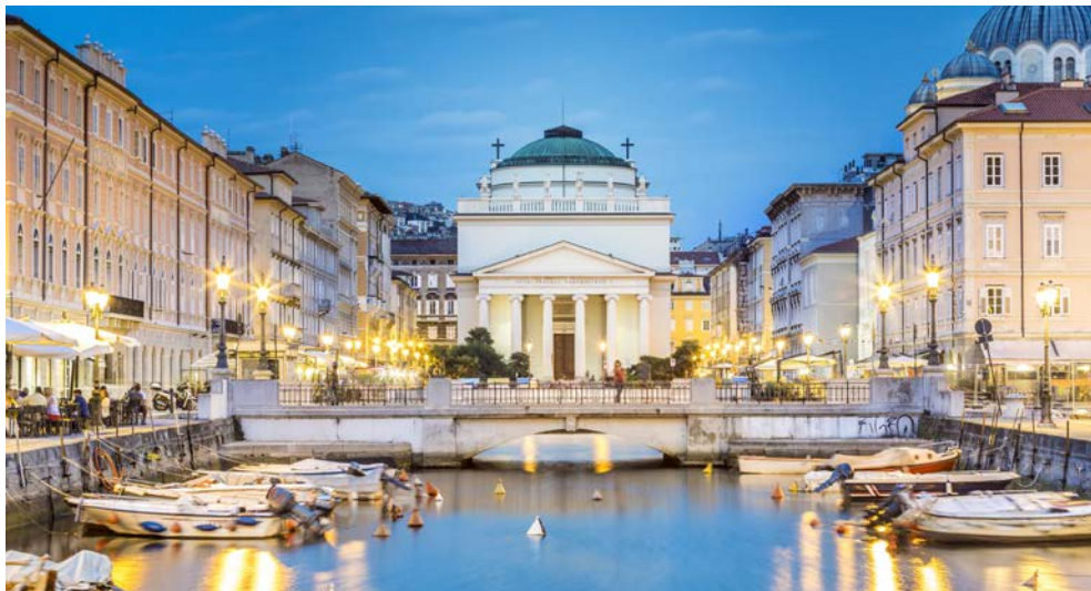
Mein Schiff 5 liegt über Nacht in Triest – wunderbar!