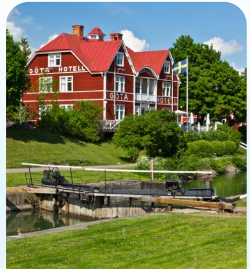
Das historische Gota Hotel direkt am Kanal

Tipp: Besuchen Sie unbedingt den Sky-View – hier können Sie mit einer Art gläsernen Fahrstuhl an der Außenwand der Globenarena