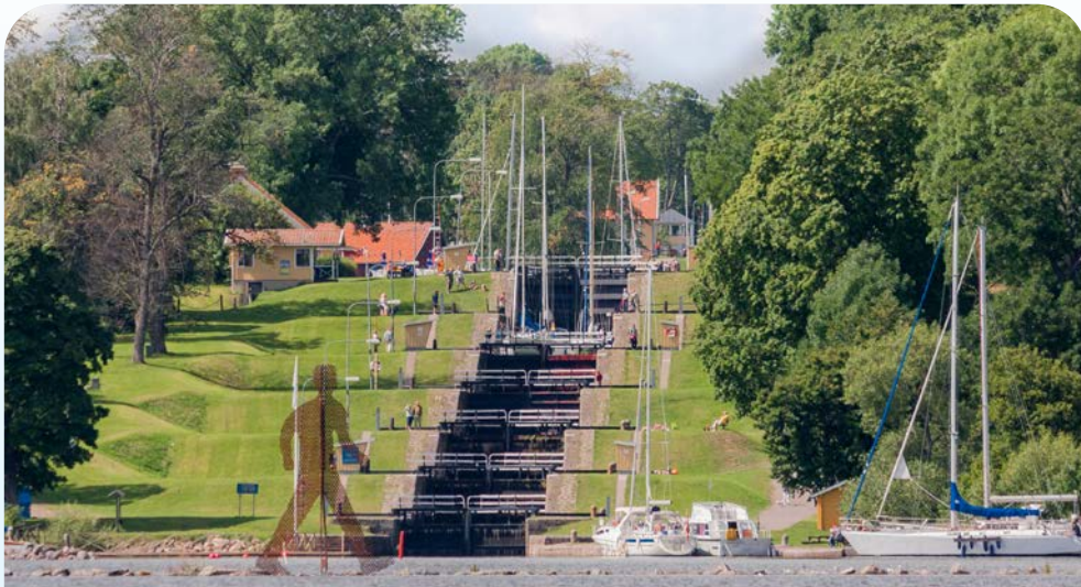
Die Schleusen des Götakanals

umfassenden Sammlung von Autos und Motorrädern in zeittypischen Szenarien mit Radios, Spielzeug, Kuriositäten etc. Sie haben auch die Möglichkeit, ca. 1 km am linken Kanalufer entlang zu Baltzar von Platens Grab (Gründer des Göta Kanals) zu spazieren. Die Schleusentreppe in Borens-hult ist mit fünf zusammenhängenden Schleusen und einem gesamten Höhenunterschied von 15,3 m die zweitgrößte Treppe des Kanals. Danach gleiten Sie langsam über den See Boren, zum idyllischen Kanaldorf Borensberg. Direkt hinter der Schleuse in Borensberg befindet sich das bekannte Göta Hotel. Ihr Schiff liegt hier über Nacht.