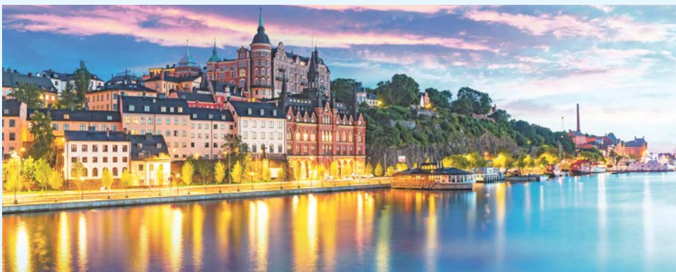
Blick auf Stockholm