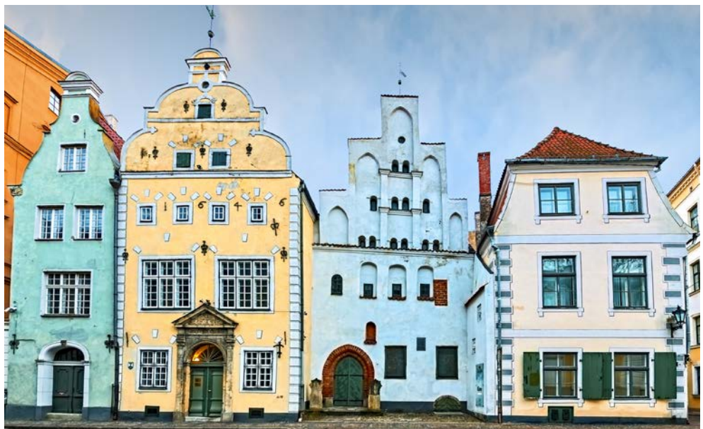
Mittelalter Fassaden in der historischen Altstadt