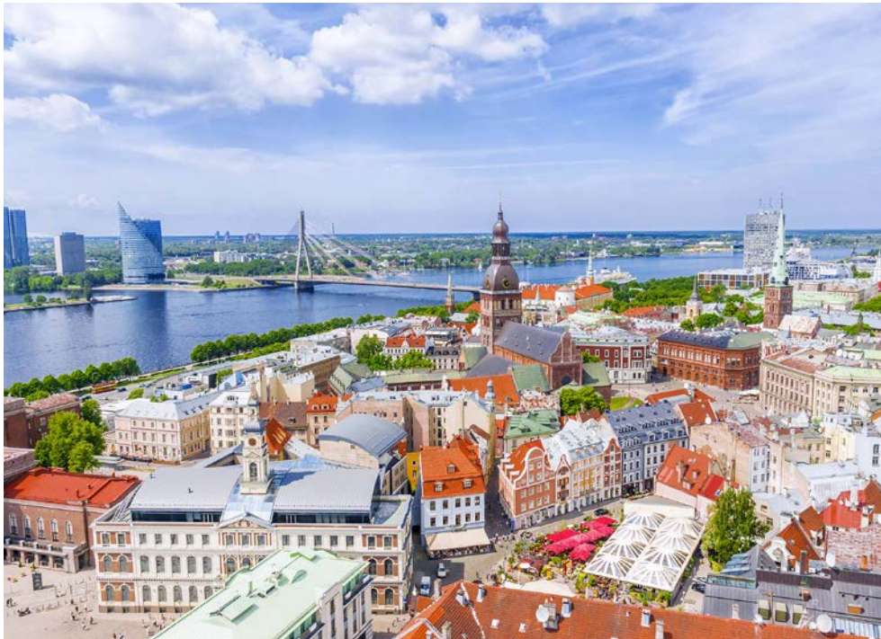
Blick über Rigas Altstadt