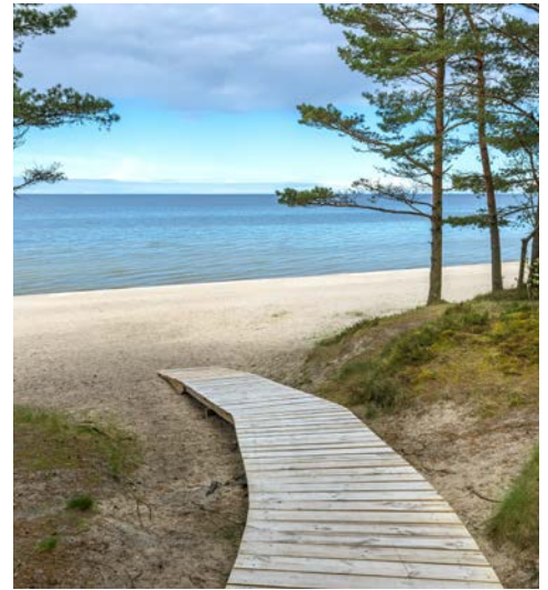
Am Strand von Jurmala