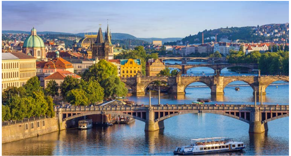
Nach ausgiebigen Erkundungen startet Ihre Radtour in Prag

Von der goldenen Stadt Prag nach Dresden, auf dem unvergesslich schönen Elberadweg, an weitläufigen Flusslandschaften von Moldau und Elbe. Das Barockkloster der Kapuziner, die alte Königstadt Leitmeritz oder die Fahrt durch die beeindruckende Porta Bohemica/die Elbschlucht, die sächsische Schweiz mit ihrem beeindruckenden Elbsandsteingebirge, das sind nur einige der zahlreichen Highlights dieser Reise. Den schönen Abschluss dieser Reise bildet Dresden, das kulturelle Zentrum Sachsens, mit dem Zwinger, der Frauenkirche, Theaterplatz und Semperoper. Ein weiterer Höhepunkt wird Sie begeistern – gehen Sie mit dem Rad in Dresden auf Entdeckungstour. Lernen Sie die Highlights und außergewöhnlichen Orte abseits der bekannten Pfade Dresdens kennen.