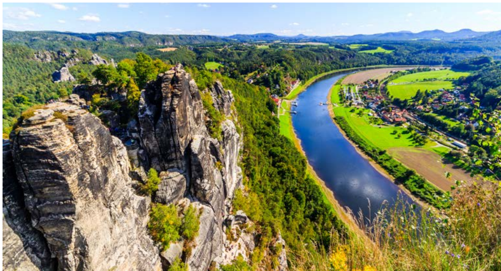
Kurz vor Dresden passieren Sie das Elbsandsteingebirge.