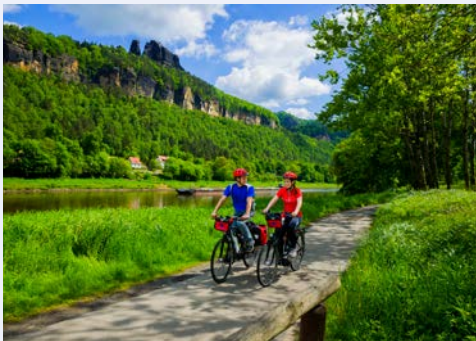
Meistens direkt am Ufer, der Elberadweg