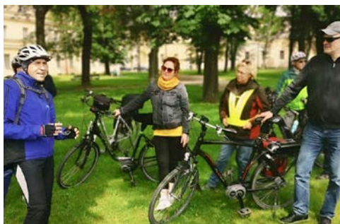
Immer wieder kleine Pausen und interessante Infos

Immer die Elbe im Blick erreichen Sie schon nach einigen Kilometern das Elbsandsteingebirge. Bei Hrensko überqueren Sie die Deutsch-Tschechische Grenze und fahren weiter nach Bad Schandau, der sächsischen Kleinstadt und dem staatlich anerkannten Kneippkurort. Hier führt der Radweg direkt an der Elb-Promenade entlang. Nach einer kurzen Stadtbesichtigung und Pause geht es weiter nach Königstein. Die Stadt verdankt ihren Namen der Festung Königstein, der größten Bergfestung Europas, die auf einem Tafelberg erbaut wurde. Mittagspause in Königstein. Umgeben von der bizarren Felsenwelt der Sächsischen Schweiz fahren Sie weiter nach Pirna, einer sächsischen Kleinstadt mit einem wunderschönen historischen Altstadt kern. Lassen Sie einen Hauch von Nostalgie zusammen mit den Eindrücken einer der reizvollsten Flusslandschaften Europas auf sich wirken. (Aus organisatorischen Gründen kann die Übernachtung auch in Dresden erfolgen. Der Bus bringt Sie und Ihre Fahrräder dann von Pirna zum Hotel in Dresden und am nächsten Tag wieder zurück nach Pirna, wo Ihre Fahrradtour wieder startet.)