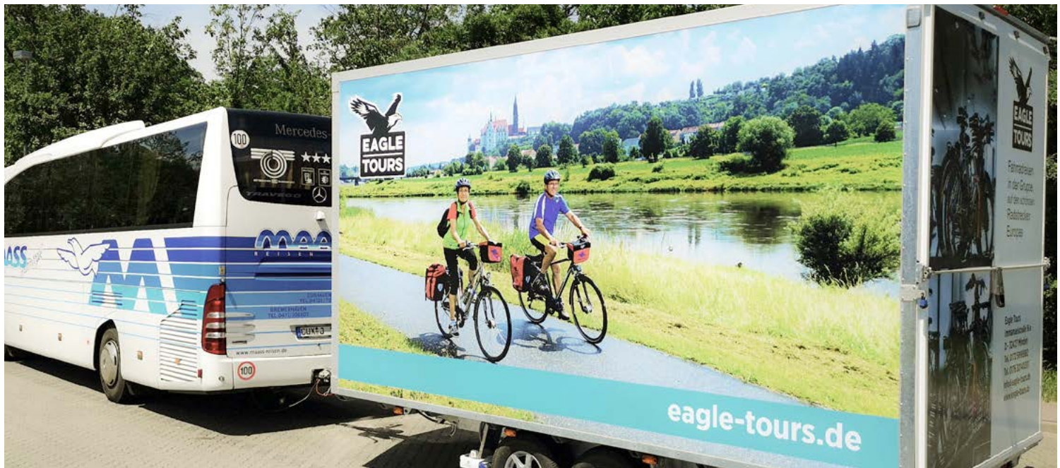
Der Bus mit Radanhänger begleitet Sie während der Reise