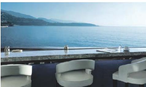
Blick von der Hotelterrasse

Im Herzen des Fürstentums, in der Nähe des legendären Casinos gelegen, ist das Fairmont Monte Carlo (Landeskategorie: 4 Sterne Plus) mit über 600 Zimmern und Suiten eines der größten Hotels in Europa.