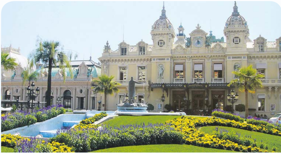
Das Spielkasino in Monte Carlo