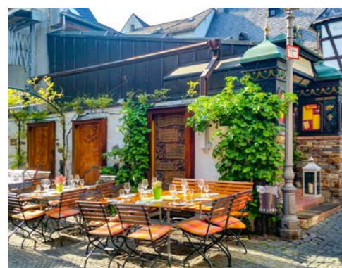
Genießen Sie Wein in einer der Schankwirtschaften

Einzelkabinen ab € 1.679,- und weitere Kategorien auf Anfrage buchbar, limitiertes Kontingent. Sie erhalten Ihre Kabinennummer mit den Reiseunterlagen. *Sonderpreise gültig bei Buchung bis zum 06.08.2021. Glück Kabinen: Der Veranstalter wählt die Kabine. VIP Kabinen: inklusive Obstteller und 1 Flasche Sekt zur Begrüßung.