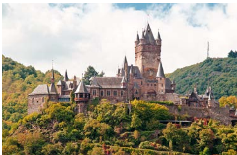
Die Reichsburg thront über Cochem

die vielen Weinberge. Für den Aufstieg nimmt man am besten den Weg über das „Tummelchen“ mit seinem alten „Zuckertürmchen“, das zur Bewachung der Stadtgrenze diente, und auf den Resten der historischen Stadtmauer steht. Wie wäre es mit einem kleinen Ausflug? Gegen Mittag nehmen Sie Kurs auf Koblenz, die Stadt am Deutschen Eck, am Zusammenfluss von Mosel und Rhein.