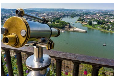
Blick auf das Deutsche Eck

In Köln endet Ihre erlebnisreiche Flussreise auf Rhein und Mosel.