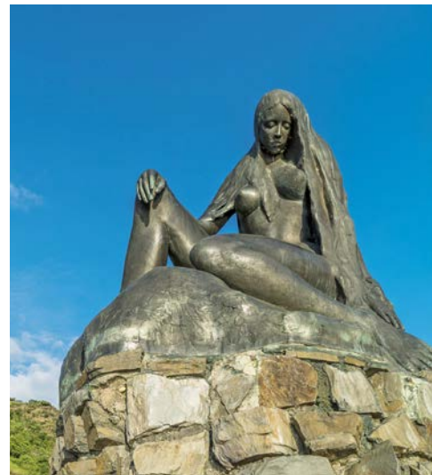
Lassen Sie sich von der Loreley betören

die vielen Weinberge. Für den Aufstieg nimmt man am besten den Weg über das „Tummelchen“ mit seinem alten „Zuckertürmchen“, das zur Bewachung der Stadtgrenze diente, und auf den Resten der historischen Stadtmauer steht. Wie wäre es mit einem kleinen Ausflug? Gegen Mittag nehmen Sie Kurs auf Koblenz, die Stadt am Deutschen Eck, am Zusammenfluss von Mosel und Rhein.