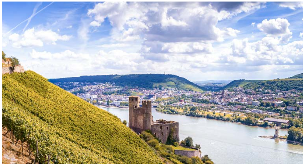
Burg Ehrenfels bei Rüdesheim

Herzlich Willkommen im Weinanbaugebiet Rhein-Mosel!