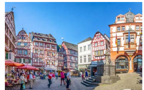
Der Marktplatz von Bernkastel-Kues

Erleben Sie die unvergleichliche Mosel-Atmosphäre zunächst noch einmal in Bernkastel-Kues – vielleicht bei einem Spaziergang entlang des weitläufigen Moselufers. Anschließend bringt Sie Ihr Schiff weiter nach Cochem, ein verträumtes Städtchen mit verwinkelten Gassen und liebevoll restaurierten Fachwerkhäusern. Lohnenswert ist ein gemütlicher Spaziergang durch das viel besuchte Weinstädtchen. Die zahlreichen gut erhaltenen Reste der historischen Stadtmauer mit ihren alten Befestigungswerken zeugen noch heute von der belebten Vergangenheit.