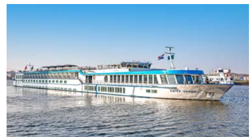
... an Bord der SWISS CROWN

Weitere buchungsrelevante Informationen zu dieser Reise (An- und Abreise, Gesundheitshinweise, Barrierefreiheit, eventuell anfallende Mehrkosten während der Reise etc.) erhalten Sie im Internet unter: www.haz.de/leserreisen