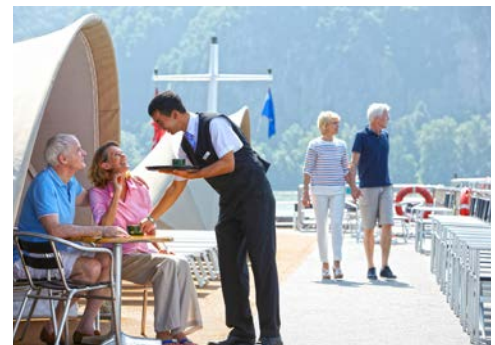
Herzlicher Service ...

Programmänderungen vorbehalten. An- und Abreisetag dienen ausschließlich der Erbringung der vertraglichen Beförderungsleistungen. Stand 01/21 – alle Angaben ohne Gewähr.