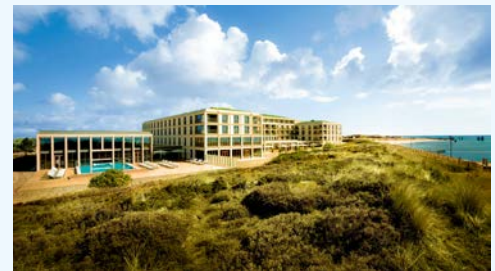
List: Superior A-ROSA Hotel Sylt

Ein Bus bringt Sie nach dem Frühstück an den Bahnhof nach Westerland. Nach erholsamen Tagen treten Sie die Heimreise mit dem 1. Klasse-Sonderzug AKE-RHEINGOLD an.