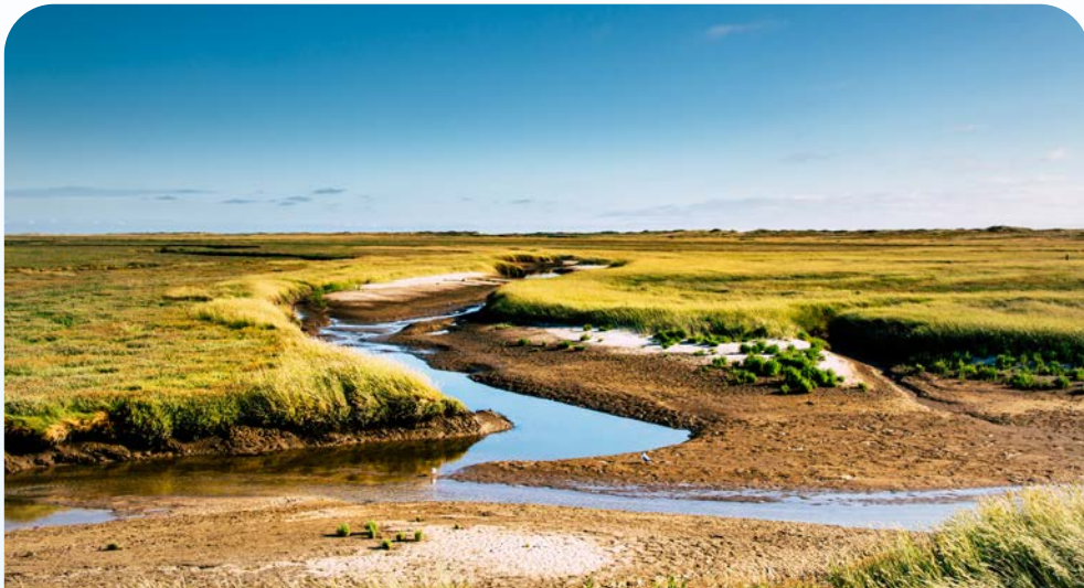
St Peter Ording, Priel