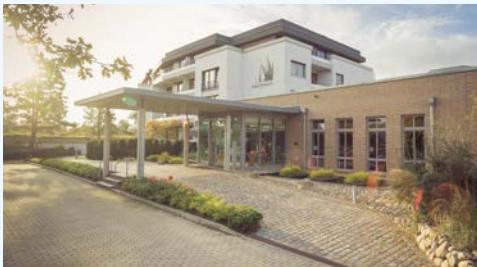
St. Peter-Ording: AALERNHÜS Hotel & Spa

Anreise mit dem 1. Klasse-Sonderzug AKE-RHEINGOLD nach Friedrichstadt. Anschließend erfolgt der Bus- und Gepäcktransfer zu Ihrem gebuchten Hotel in St. Peter-Ording. Nutzen Sie den Rest des Tages für einen ersten Spaziergang in Ihrem Urlaubsort. Im quirligen Ortsteil Bad laden Restaurants, Cafés und kleine Boutiquen mit maritimem Flair zum Flanieren ein. Im Ortsteil Dorf erwartet Sie eine heimelige und ruhigere Atmosphäre. Gut erhaltene Reetdachhäuser blinzeln über den alten Deich und wechseln sich mit modernen Gebäuden ab.