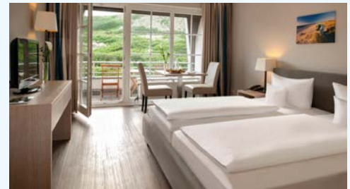
Westerland: Dorint Strandresort und Spa, Zimmerbeispiel