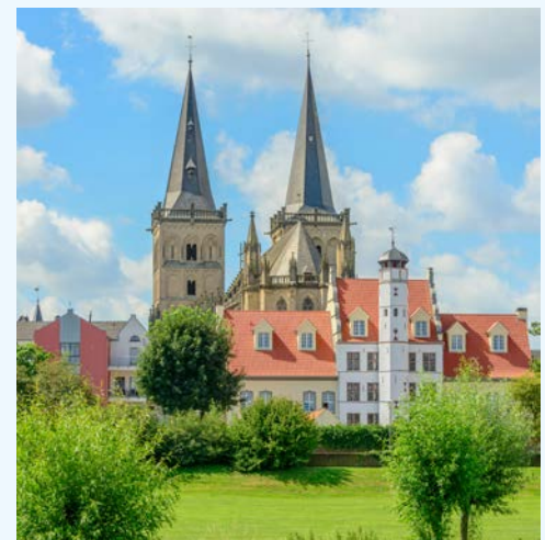
Dom in Xanten

Nachts bringt Sie Ihr Schiff bis nach Xanten. Den Römern gefiel es hier bereits vor 2.000 Jahren so gut, dass sie sich niederließen und das heutige Xanten gründeten. Ein Abstecher in den Archäologischen Park in Xanten ist empfehlenswert. Ab hier startet Ihre heutige Radetappe vorbei an Naherholungsgebieten, über das sehenswerte Örtchen Kalkar bis Sie Deutschlands älteste Hängebrücke in Emmerich erreichen, wo Ihr Schiff Sie erwartet. Am Abend erfolgt die Weiterfahrt über die deutsch-niederländische Grenze nach Arnhem.