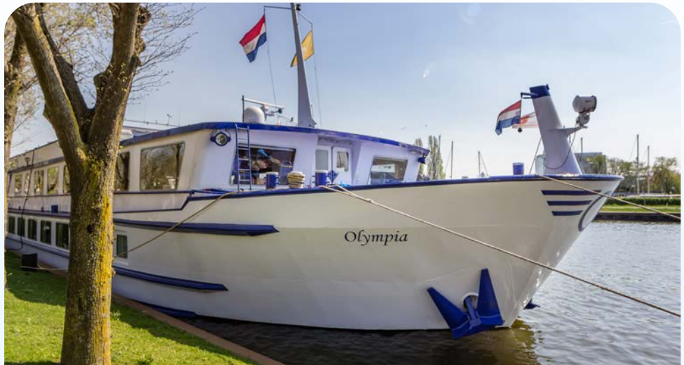
Ihr Schiff – die OLYMPIA