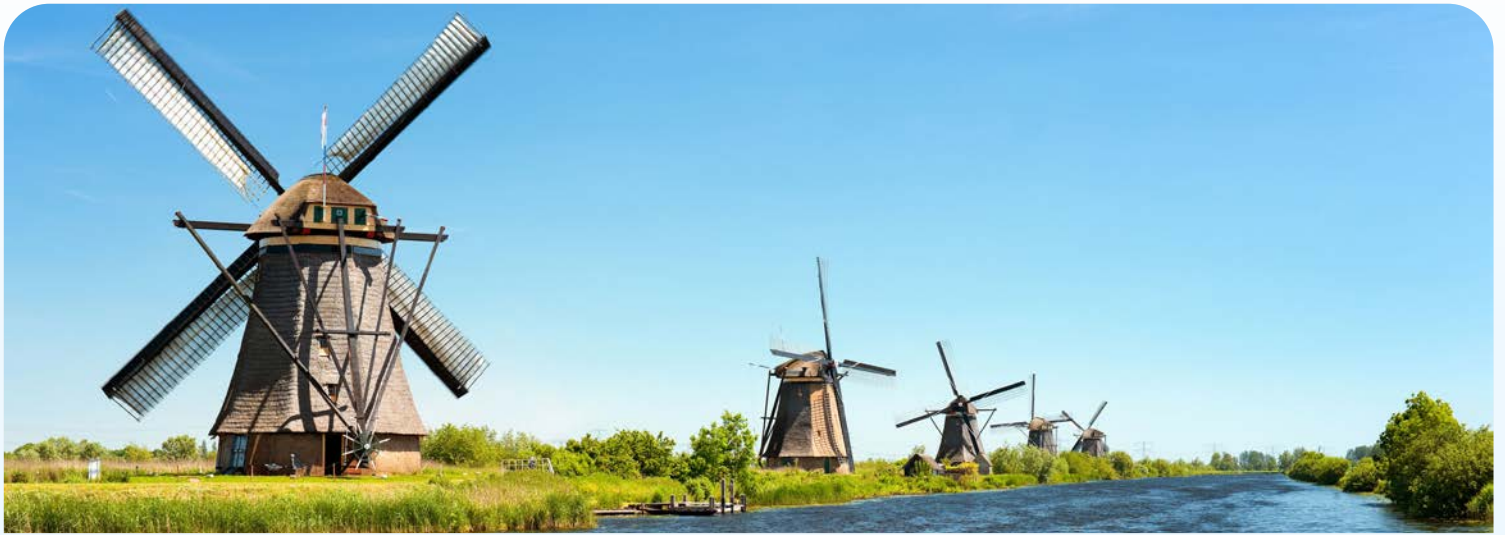
Windmühlen von Kinderdijk