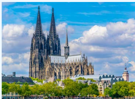
Köln – Start und Endpunkt Ihrer Reise