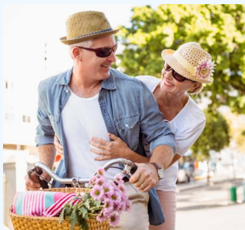
Entdecken Sie die Niederlande per Rad