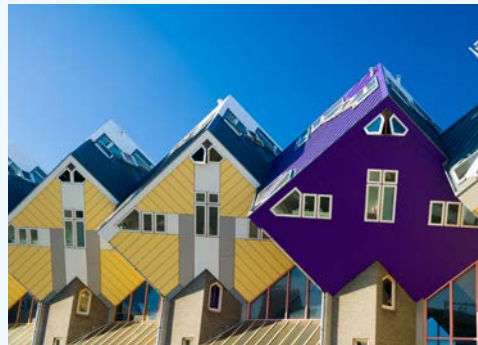
Faszinierende Architektur in Rotterdam

Auf der letzten Radetappe erleben Sie die bekanntesten Windmühlen der Niederlande am Kinderdijk. Die 19 noch gut erhaltenen Mühlen stammen aus dem 18. Jahrhundert und wurden von der UNESCO zum Weltkulturerbe ernannt. Ein Besuch lohnt sich! Weiter führt Sie Ihr Weg am Fluss Maas entlang bis nach Rotterdam, dem größten Hafen der Welt.