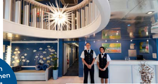
Die Crew heißt Sie willkommen

Für Buchungen & Informationen im Internet klicken Sie hier