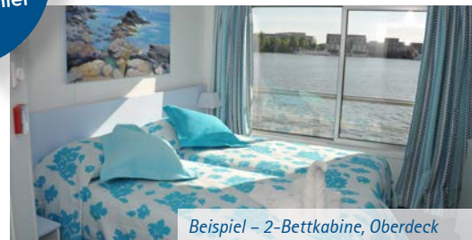
Beispiel – 2-Bettkabine, Oberdeck