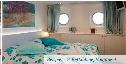
Beispiel – 2-Bettkabine, Hauptdeck