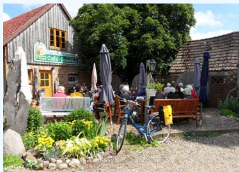
Eine kurze Pause zwischendurch

Durch das Ruppiner Seengebiet führt der gut ausgebaute Radweg Richtung Norden nach Oranienburg. Sehenswert: das Barockschloss mit Park, Museum und Orangerie. Hier gehen Sie wieder an Bord und fahren bis nach Eberswalde. Im Herzen der Stadt, im Finowkanal, befindet sich die älteste betriebsfähige Schleuse Deutschlands, die seit 1978 ein technisches Denkmal ist.