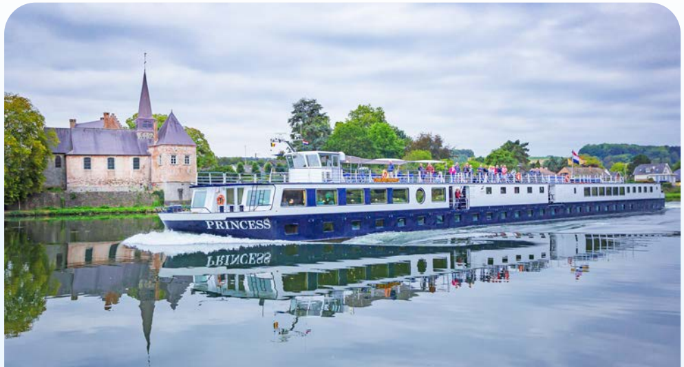
Die PRINCESS erwartet Sie