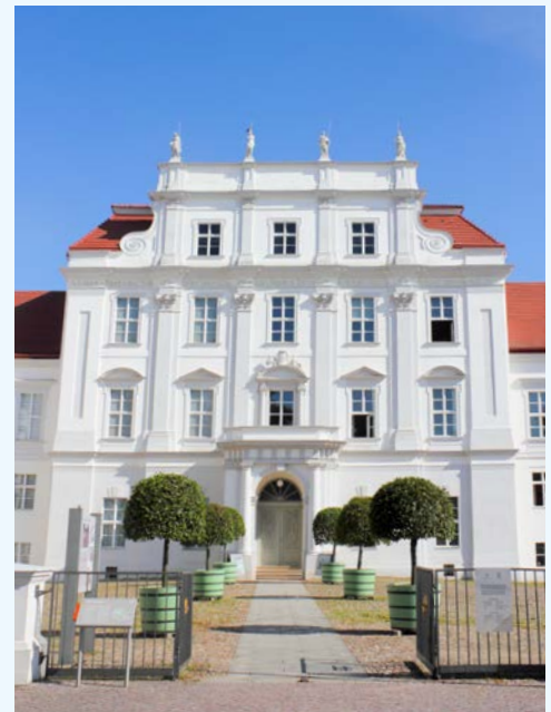
Barockschloss in Oranienburg