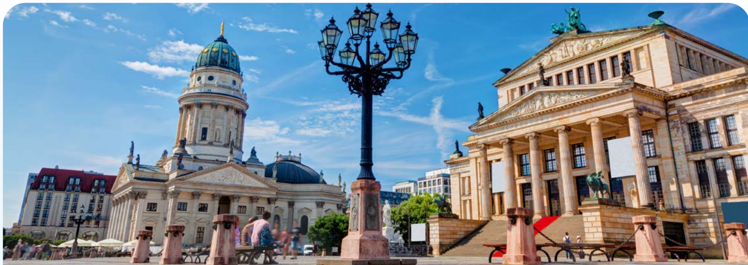
Unverkennbar – der Gendarmenmarkt in Berlin