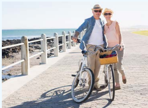
Ihre Radtour kann beginnen