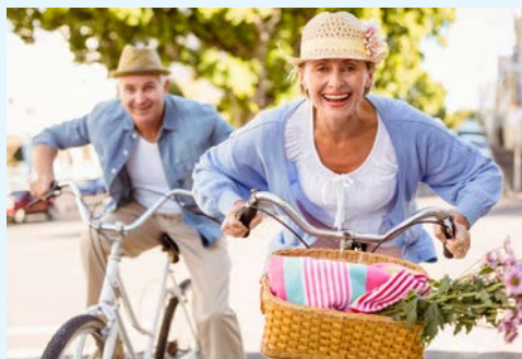
Entdecken Sie Holland per Rad