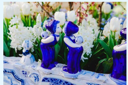
Delfter Porzellan – vielleicht ein Souvenir für daheim?

Heute geht es mit dem Rad von Schoonhoven durch das bezaubernde „Grüne Herz“ entlang kleiner Dörfer und über ruhige Wege und Landstraßen nach Utrecht. Unterwegs können Sie einen traditionellen Bio-Käsebauernhof und das Hexenwaage-Haus in Oudewater besuchen. Am späten Nachmittag fährt das Schiff von Utrecht nach Haarlem.