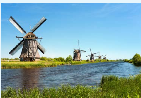
Windmühlen in Kinderdijk