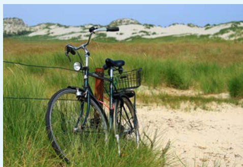
Abstecher an die Nordseeküste