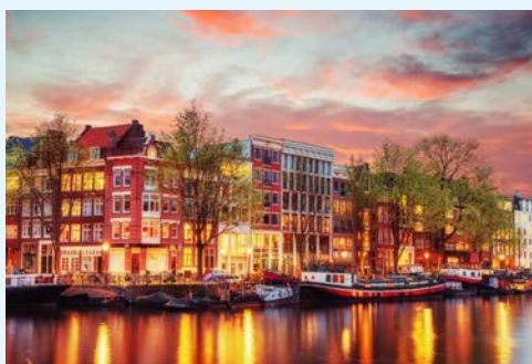
Das bezaubernde Amsterdam

Heute stehen zwei Radtouren zur Auswahl. Beide Touren führen durch die zauberhaften Kennedünen, einem Naturschutzgebiet mit vielen Vögeln, schottischen Hochlandrindern und Shetlandponys. Nachdem Sie die Badeorte Bloemendaal aan Zee und Zandvoort besucht haben, fahren Sie durch Wälder und das Zentrum von Haarlem zurück zum Schiff. Bei der etwas längeren Tour führt Sie die Strecke auch zum historischen Pumpwerk De Cruquius, der größten Dampfmaschine der Welt. Während des Abendessens fährt das Schiff nach Zaandam. Wer Lust hat, kann von Haarlem aus auch die berühmte Tulpenausstellung „Keukenhof“ bei Lisse besuchen* (mit dem Fahrrad oder mit dem öffentlichen Nahverkehr; Fahrtkosten und Eintrittspreis „Keukenhof“ sind nicht inklusive).