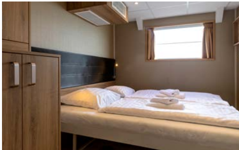
Beispiel 2-Bettkabine Unterdeck Superior

Die DE NASSAU ist ein gemütliches Flussschiff (im Februar 2019 teilrenoviert) mit großem Salon mit Panoramafenster, welcher in Restaurant, Bar und Lounge unterteilt ist. Das teilweise überdachte Sonnendeck lädt mit Sitzplätzen und Liegen zum Verweilen ein. Auch dient das Sonnendeck zum Abstellen der Fahrräder. W-LAN gegen Gebühr.