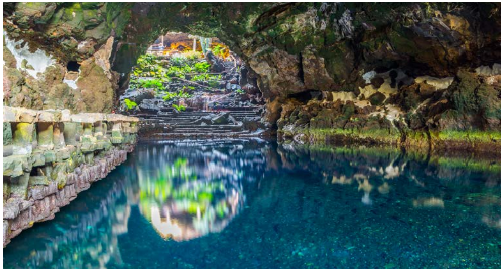
Grotte „Jameos del Agua“

Möchten Sie den Sommer schon früher erleben? Lanzarote ist hierfür das ideale Reiseziel, denn die östlichste der Kanarischen Inseln bietet mit ihren ganzjährig angenehmen Temperaturen um die 23 °C für jeden Geschmack genau das Richtige! Trotz oder gerade aufgrund des vulkanischen Ursprungs ist die Landschaft der Insel faszinierend und bizarr. Teils dunkle Strände und teils feiner, weißer Sand, zahlreiche große und kleinen Buchten, im Landesinnern eine mondähnliche Wüste, die „Feuerberge“, ein Tal mit tausend Palmen, unterirdische Seen mit blinden weißen Krebsen und Vulkantunnelsysteme werden Sie begeistern. Nutzen Sie die Zeit zum Entspannen, im Meer zu baden oder nehmen Sie an den Ausflugsmöglichkeiten dieser Reise teil, die Ihnen Land und Leute näher bringen werden. Sie wandeln außerdem auf den Spuren des größten kanarischen Künstlers, César Manrique, welcher die Insel maßgebend prägte.