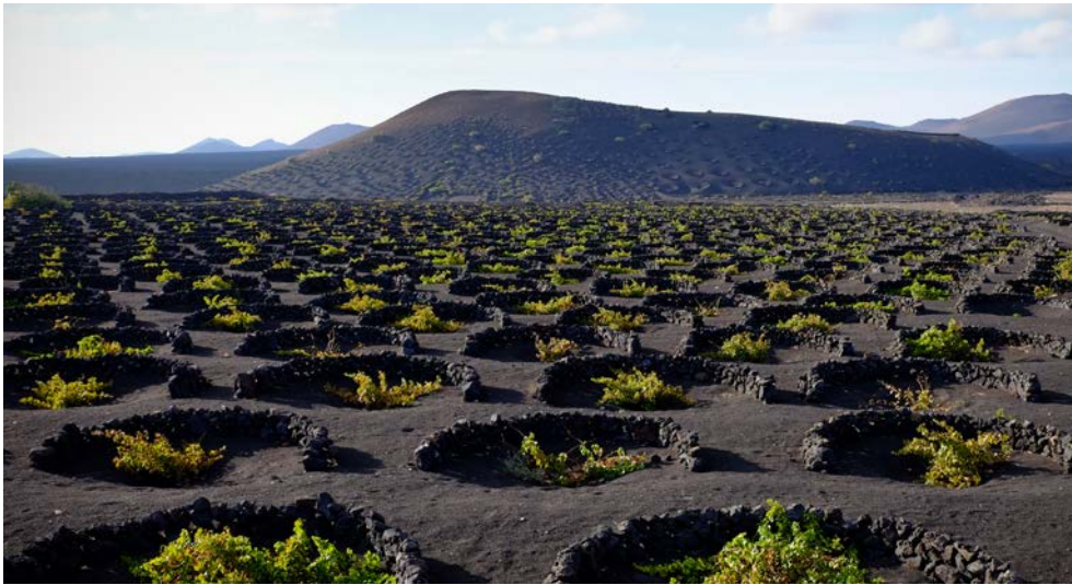
Weinanbaugebiet El Grifo

Informationen. Begeben Sie sich auf eine Reise durch die Zeit, auf der Sie einmalige Einblicke in den früheren bäuerlichen Alltag bekommen. Lassen Sie sich nach der Besichtigung mit leckeren Köstlichkeiten und dem Wein des Hauses verwöhnen.