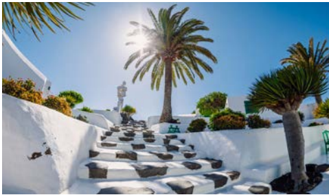
Das Monumento al Campesino von César Manrique

Informationen. Begeben Sie sich auf eine Reise durch die Zeit, auf der Sie einmalige Einblicke in den früheren bäuerlichen Alltag bekommen. Lassen Sie sich nach der Besichtigung mit leckeren Köstlichkeiten und dem Wein des Hauses verwöhnen.