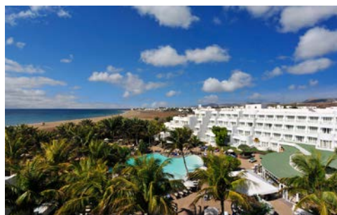
Blick über die Hotel-Anlage

Wenn Sie etwas für Ihr Wohlbefinden tun möchten, sollten Sie einen Besuch in der Sauna einplanen. Vielleicht in Verbindung mit einer Massage, wobei Sie aus verschiedenen Massagetechniken wählen können. Außerdem können Sie