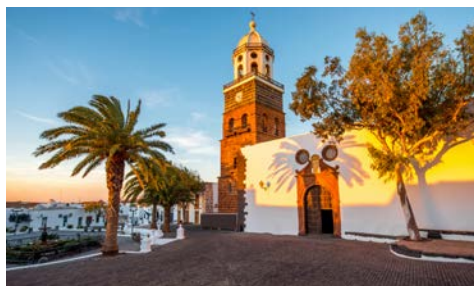
Eine echte Schönheit – Teguise