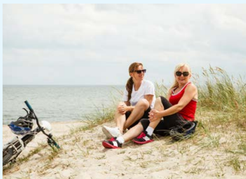
Eine kurze Auszeit am Meer

Freuen Sie sich am heutigen Tag auf eine außergewöhnlich schöne Radrundtour auf der größten niederländischen Nordseeinsel Texel. Verschiedene Routen von ca. 29 bis 70 km stehen zur Wahl. Gegen Abend geht es dann per Schiff weiter nach Den Helder.