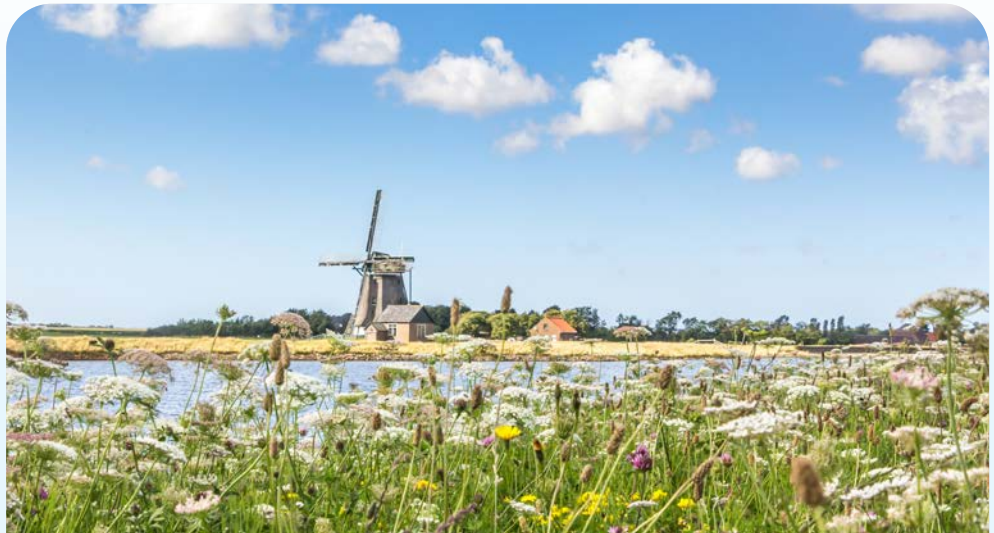
Idyllische Landschaft auf Texel

an drei Seiten von Wasser umgeben – die niederländische Provinz Nordholland liegt auf einer Halbinsel zwischen der Nordsee, dem Watten- und dem IJsselmeer. Die reiche Geschichte Nordhollands ist bis heute vielerorts sichtbar. Malerische Städtchen erzählen von einer Zeit als das IJsselmeer noch Zuiderzee hieß und einen offenen Zugang zur Nordsee hatte. Ein Besuch des Zuiderzeemuseums in Enkhuizen lässt diese Zeiten wieder aufleben. Entdecken Sie die Halbinsel zwischen der Nordsee, dem IJsselmeer und Texel, der größten westfriesischen Insel. Eine Landschaft geprägt von Wasser, Deichen und Dünen, Naturschutzgebieten, Blumenfeldern, Weideland und vielen malerischen Städtchen.