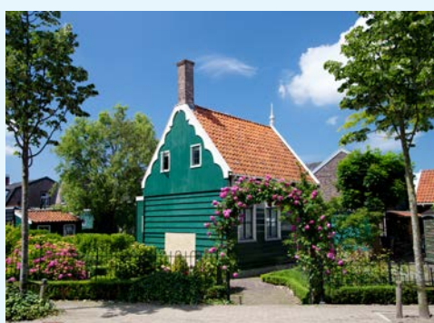
Zaanse Schans – Ein Besuch ist lohnenswert