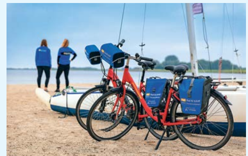
Unterwegs mit dem Mietfahrad

Per Rad geht es zum Sondeler Leien See, von dort durch das Waldgebiet Rijsterbos, vorbei an dem Vogelreservat Mokkebank zum Roode Klif nach Stavoren. Hier gehen Sie wieder an Bord der SERENA und fahren nach nach Oudeschild auf der Insel Texel.