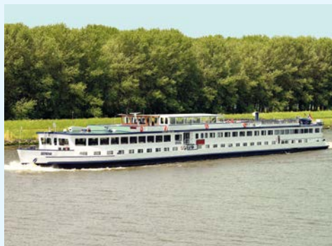
Willkommen auf der SERENA

Taxi-Service (falls gebucht) zum Bus, Busfahrt von Hannover nach Amsterdam. Hier erwartet Sie die SERENA bereits zur Einschiffung. Vielleicht haben Sie noch Zeit zur Erkundung der Altstadt der charmanten Metropole. Um 17.30 Uhr beginnt Ihre erste Etappe per Schiff, die SERENA bringt Sie ins schöne Hafentstädtchen Hoorn.