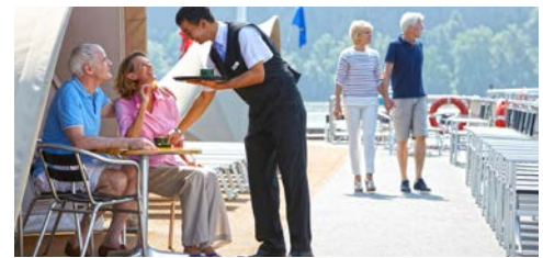
Herzlicher Service ...

Programmänderungen vorbehalten. An- und Abreisetag dienen ausschließlich der Erbringung der vertraglichen Beförderungsleistungen. Stand 04/21 – alle Angaben ohne Gewähr.