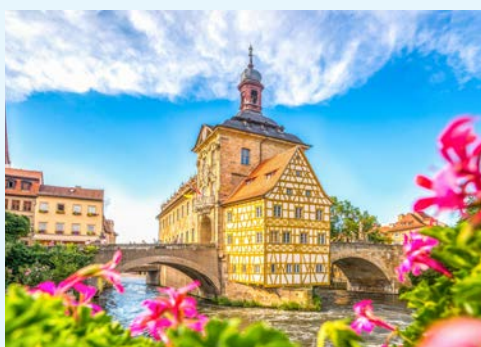
Bamberg lohnt mehr als einen Blick

– bei entsprechendem Wetter – die Liegestühle auf dem Sonnendeck, nutzen. Während des Mittagessens erreichen Sie Gerlachshausen. Hier erwartet Sie Ihr Reisebus und bringt Sie nach Würzburg. Würzburg liegt mitten im fränkischen Weinbaugebiet, an beiden Ufern des Mains. Das Gesamtbild der Stadt wird von der mittelalterlichen Festung Marienberg beherrscht. Auf dem rechten Mainufer steht die fürstbischöfliche Residenz, eine der großartigsten Schlossbauten des Barocks und auf der UNESCO-Liste des Weltkulturerbes. Bei einem geführten Stadtrundgang lernen Sie die wichtigsten Sehenswürdigkeiten der alten Haupt- und Bischofsstadt Würzburg kennen, wie den Residenzplatz, den Dom, die Neumünsterkirche, das Haus zum Falken und das alte Rathaus. Danach bleibt sicher noch etwas Zeit für einen Bummel auf eigene Faust. Abendessen an Bord.