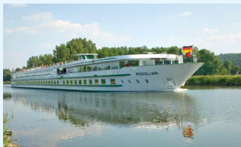
Die MODIGLIANI bringt Sie ganz nah ran

Einige Stopps dienen der Ausflugsabwicklung. Fahrplanänderung vorbehalten.