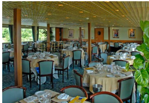
Restaurant an Bord

Trinkgeld: Es ist üblich, dem Bedienungspersonal ein Trinkgeld zukommen zu lassen. Der Betrag ist selbstverständlich freiwillig und sollte Anerkennung für eine gute Leistung sein. Vorgeschlagen wird ein