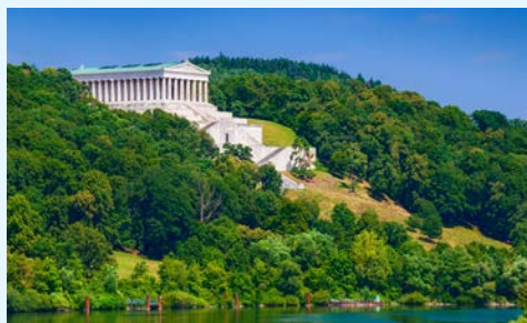
Walhalla bei Donaustauf

Nachts verlässt Ihr Schiff Bamberg und nimmt Kurs auf Würzburg. Der heutige Morgen steht ganz im Zeichen der Gemütlichkeit einer Flusskreuzfahrt. Lassen Sie sich in aller Ruhe Ihr Buffetfrühstück schmecken. Danach können Sie die Einrichtungen Ihres Schiffes, wie den Salon mit Bar oder auch