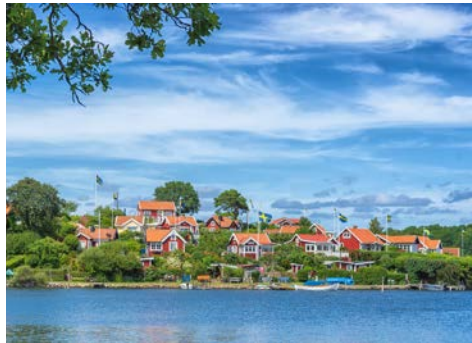
Karlskrona heißt Sie willkommen!