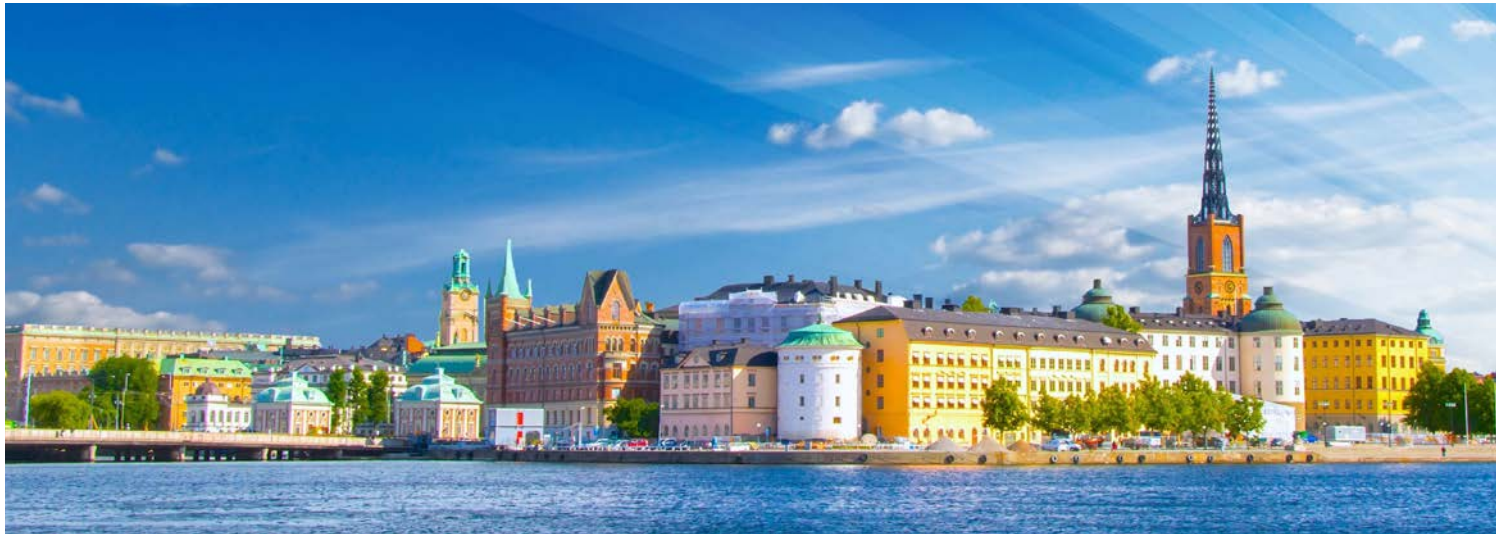
Blick auf die Altstadt „Gamla Stan“ von Stockholm

Insel und die Stadt Mariehamn mit den charmanten Holzhäusern, der lebendigen Wikinger Geschichte und der unberührten Schärenlandschaft näher kennen.