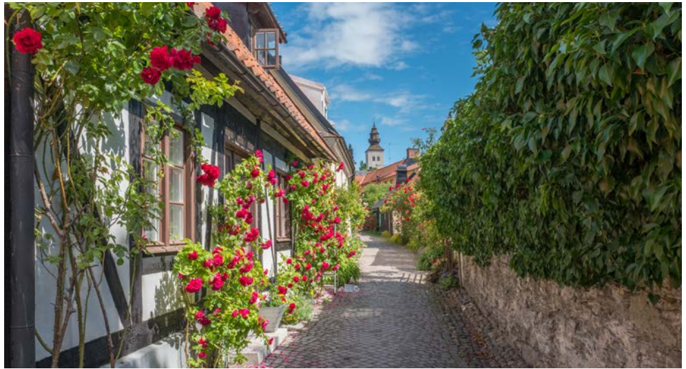
Visby auf Gotland

Schweden verzaubert nicht nur Naturliebhaber mit einer unberührten und abwechslungsreichen Landschaft. Die Fjorde und Schären entlang der Küste und die kleinen Dörfer, die aussehen als seien Astrid Lindgrens Geschichten in Bullerbü Wirklichkeit geworden, laden ein von Ihnen entdeckt zu werden. Die Ocean Majesty heißt Sie in Kiel herzlich willkommen und nimmt Kurs auf Bornholm. Der Hafen in Rønne liegt am Fuße der Kirche St. Nicolai und von hier können Sie die Altstadt mit ihren schönen Fachwerkhäusern und malerischen Gassen zu Fuß erkunden. Die Fahrt führt weiter über den malerischen Schärengarten nach Karlskrona. In Kalmar zeugt das Schloss von der bewegten Geschichte Schwedens und gilt als Wahrzeichen der Region. Erleben Sie am Abend am Deck wenn die Ocean Majesty die Meerenge Kalmarsund durchfährt. Über Gotland erreichen Sie Stockholm, das Sie mit königlichem Charme und schwimmenden Schlössern verzaubern wird, bevor Sie Kiel wieder erreichen und es Abschiednehmen heißt.