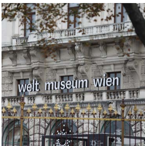
Entdecken Sie die Kulturen und Traditionen vieler Völker