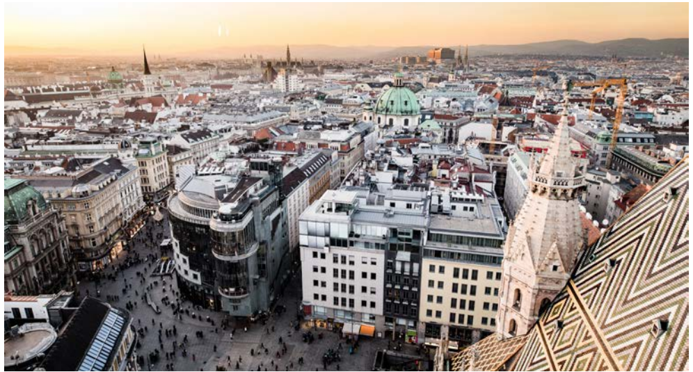
Herzlich willkommen in Wien

Feiern Sie den Jahreswechsel 2022 / 2023 in der ehemaligen Kaisermetropole mit ihren großartigen Zeugnissen der Habsburgerdynastie, wie die Hofburg und der eleganten Ringstrasse. Entdecken Sie auf geführten Spaziergängen die Stadt an der „schönen blauen“ Donau, wo kosmopolitischer Flair und Nostalgie zusammengehören. Besuchen Sie in der weltbekannten Albertina die einzigartige Sammlung Batliner „Monet bis Picasso“ und erleben Sie auf einem Rundgang eines der weltbekannten Opernhäuser, die Wiener Staatsoper. Durchschreiten Sie die Kaiserappartements im Sisi-Museum, steigen Sie hinab in die Kaisergruft und bestaunen Sie die Künste der weltbekannten Lipizaner der Spanischen Hofreitschule. Entdecken Sie im 2020 neu eröffneten Weltmuseum Kulturen und Traditionen der ganzen Welt und genießen Sie den Wiener Charme in einem der unzähligen Kaffeehäuser bei einer Melange oder einem kleinen Schwarzen.