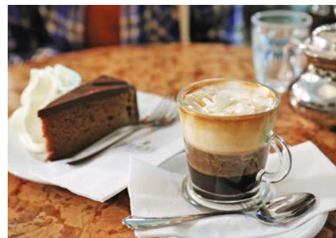
Vielleicht kehren Sie zwischendurch in einem Café ein?