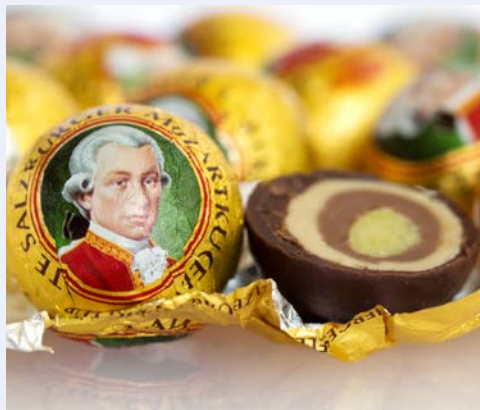
Mozartkugeln sind ein schönes Souvenir