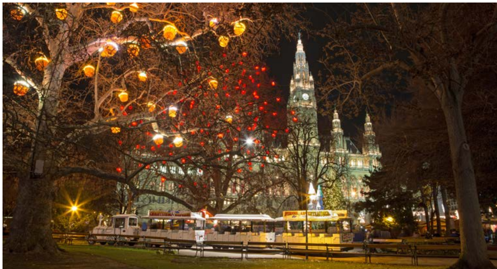
Das Rathaus in Wien