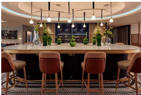
Die Executive Lounge