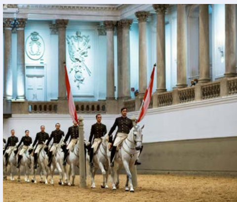
In der Spanische Hofreitschule

Am Nachmittag unternehmen Sie einen Spaziergang zur Wiener Staatsoper, wo Sie ein Rundgang durch eines der bekanntesten Opernhäuser der Welt erwartet. Der Abend steht zur freien Verfügung. Alternativ können Sie ein Konzert des Salonorchesters „Alt-Wien“ im Kursalon des Stadtparkes besuchen.