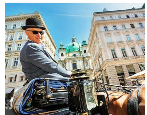
Freuen Sie sich auf die Fiakerfahrt

Ihr heutiger Tag steht ganz im Zeichen der Hofburg, Amtssitz des österreichischen Staatsoberhauptes, blickt sie auf eine 700-jährige Geschichte zurück, deren großartiger Gebäudekomplex an Glanz und Glorie der Habsburgerdynastie erinnert. Mit ihrer Reiseleitung spazieren Sie zur Hofburg, wo Sie in den Kaiserappartements das Sisi-Museums und die angegliederte Silberkammer besuchen. Was wäre Wien ohne seine Fiaker – erleben im Anschluss einen Hauch Nostalgie während einer 20-minütigen Fiakerfahrt. Nach einem gemeinsamen Mittagessen besichtigen Sie die Stallungen der Spanischen Hofreitschule.