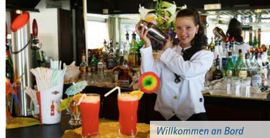
Willkommen an Bord