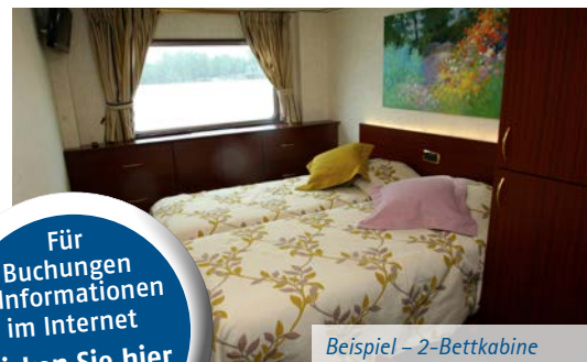
Beispiel – 2-Bettkabine

Für Buchungen & Informationen im Internet klicken Sie hier