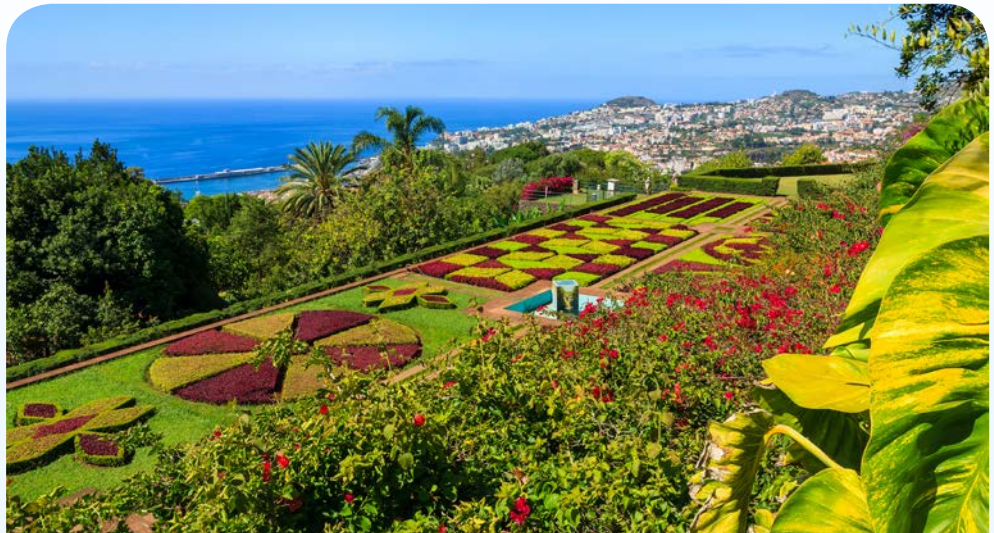
Blick über den Botanischen Garten von Funchal

Madeira ist eine eigensinnige Insel: Urige Fischerdörfer konkurrieren mit wildromantischen Tälern, hohe Berge und schroffe Felsküsten mit spektakulären Panoramen wollen entdeckt werden. Auf der Nordseite lockt der Laurisilva, der zum UNESCO-Weltnaturerbe gehörende Lorbeerwald, und die Pfade entlang der Levadas führen zu den Schönheiten tief im Inselinneren. Dazu das milde, feuchte Klima, das den Wachstum auf der „Blumeninsel“ begünstigt – Orchideen, Strelitzien, Hortensien, Afrikanischen Liebesblumen, Kaplilien ... in einer atemberaubenden Farbenpracht sind sie ganzjährige im Botanischen Garten zu bewundern. Der „ewige Frühling“ – auf Madeira ist er Wirklichkeit.