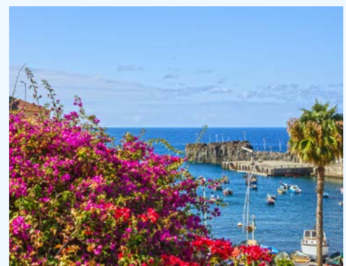
Camara de Lobos

Frühstück im Hotel. Bei diesem Ausflug wird es imposant. Zunächst geht es vorbei an Camara de Lobos, einem pittoresken Fischerdorf, nach Ribeira Brava. Die einst zu den reichsten Gemeinden zählende Stadt erhielt ihren Namen (übersetzt „wilder Fluss“) dank der lokalen Gebirgsformation, die durch einen Wildbach durchbrochen wird. Einen Blick auf die beeindruckende Gebirgs- und Küstenlandschaft erhalten Sie auch auf Ihrer Weiterfahrt nach Porto Moniz, einem beliebten Fischerort an der Nordwestecke Madeiras. Hier verweilen Sie