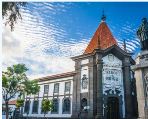
Im Zentrum von Funchal

Taxi-Service (falls gebucht) zum Flughafen Hannover und Flug nach Funchal. Empfang durch Ihre Deutsch sprechende Reiseleitung und Transfer zu Ihrem Hotel in Funchal. Beim Begrüßungsgetränk erhalten Sie wichtige Informationen zu Land und Leuten.