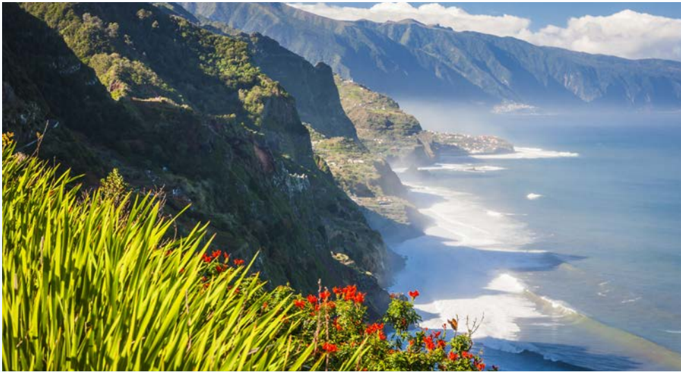
Großartige Panoramen erwarten Sie