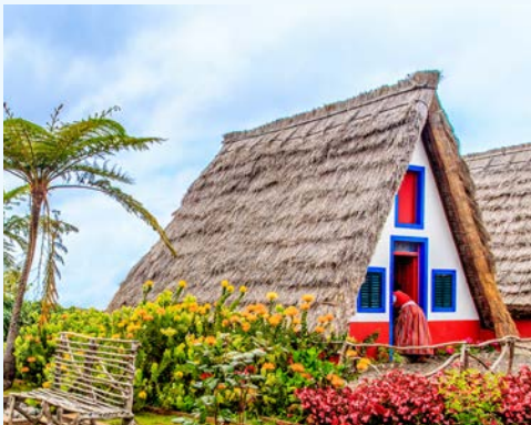
Typische Häuser in Santana

Frühstück im Hotel. Entspannen Sie sich in der Hotelanlage oder nutzen Sie die Zeit für eigene Erkundungen. Unser Tipp: Mit einer Luftseilbahn erreichen Sie von Funchal aus den Botanischen Garten im hoch gelegenen Stadtteil Monte. Das über 35.000 m 2 große abschüssige Gelände des Parks erstreckt sich von einem hoch gelegenen ehemaligen Herrenhaus bis zu einem angeschlossenen Vogelpark. Der Botanische Garten bietet neben schönen Wegen unter alten Bäumen entlang, auch verschiedene Themenbereiche wie einen Wassergarten und einen Kakteengarten.