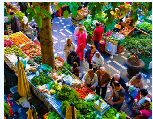
Auf dem Markt in Funchal

Nach dem Frühstück erwartet Sie ein interessanter Ausflug durch die Inselhauptstadt. Die Stadtrundfahrt bringt Sie zunächst zum berühmten Markt von Funchal: Frische wohin Sie auch sehen – Früchte und Gemüsesorten jeglicher Fassung, Blumenpracht und – besonders beliebt – der Fischmarkt. Während eines Spazierganges durch die Altstadt, sollten Sie die Türen im Blick behalten. Das Projekt „Kunst der offenen Türen“ hat im Laufe der letzten Jahre die Rua de Santa Maria und die angrenzende Umgebung in eine Art Open-Air-Kunstmuseum verwandelt. Einst das Viertel einfacher Handwerker und Fischer, wirkten begabte Künstler mit eindrucksvollen Gemälden an Türen und Toren dem drohenden Verfall entgegen. Diese Idee war so erfolgreich, dass sie sich verselbstständigte und zum Mitmachen animierte. Heute ist vom drohenden Verfall keine Spur mehr zu sehen. Den krönenden Abschluss Ihres Ausfluges bildet ein Besuch in