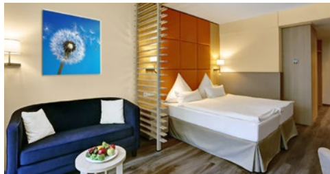
Zimmerbeispiel: DZ de Luxe

Hotel- und Programmänderungen vorbehalten. An- und Abreisetag dienen ausschließlich der Erbringung der vertraglichen Beförderungsleistungen. Stand 07/21 – alle Angaben ohne Gewähr.