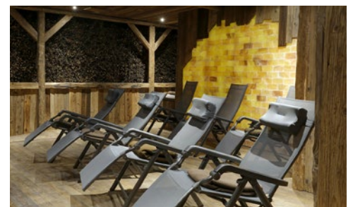
Gesunde Salzluft im hoteleigenen Gradierwerk