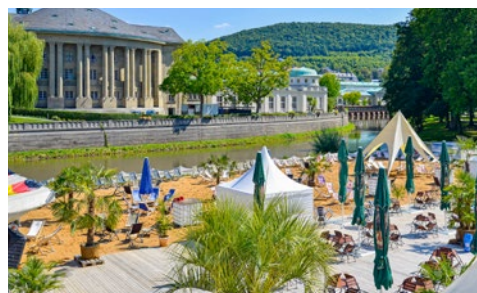
Der Stadtstrand an der Saale

Wie aus einem Kinderbuch entsprungen, wirkt das niedliche, kleine, grün-gelbe Kurbähnle, auch liebevoll Geckobahn genannt, womit Sie bequem die Stadt erkunden können. Die Strecke zwischen Innenstadt und Tierpark Klaushof wurde zunächst mit einem VW Bulli abgedeckt, heute tourt bereits die dritte Generation der beliebten Kleinbahn durch die Straßen Bad Kissingens.