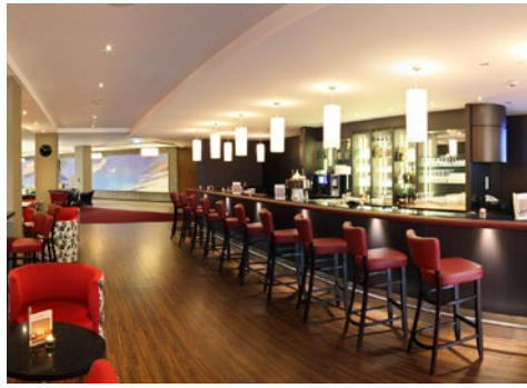
Genießen Sie ein Glas Wein in gemütlicher Atmosphäre

Doch auch die andere Richtung des Kurparks hält fantastische Überraschungen parat. Ob zu Fuß oder mit dem Ausflugsschiff geht es die Saale für rund 2,5 km entlang zur Saline mit Gradierbau. Hier heißt es dann „tief Luft holen“! Im ebenfalls nahe liegenden Altstadtkern finden Sie schöne, kleine Boutiquen, Restaurants, Cafés und typisch fränkische Gastronomie. So viel Erlebnenswertes auf kleinem Raum, kein Wunder, dass schon Persönlichkeiten wie Kaiserin Elisabeth „Sisi“ von Österreich-Ungarn und Fürst Otto von Bismarck Bad Kissingen zu schätzen wussten. Das Bismarck-Museum zeigt heute den Staatsmann aber auch den Privatmann, mit Blick in seine historische Wohnung. Auf „Sisi's Lieblingsspaziergang“ wandern Sie u. a. über den Altenberg zu einer künstlich geschaffenen Steinschlucht bis hin zum Sisi-Denkmal, das zu Ehren der Kaiserin Elisabeth errichtet wurde. Am höchsten Punkt des Altenbergs gibt es einen Tempel mit Aussichtsplattform. Von hier aus genießen Sie einen herrlichen Ausblick auf Bad Kissingen, das umliegende Saaletal und die Ausläufer der Rhön. Weitere empfehlenswerte Ausflugsziele sind der Wittelsbacher Turm, der Wildpark Klausshof, die Märchenhöhle Walldorf und das ca. 8 km entfernte Schloss Aschach. Mit dem CUP VITAL-Service-Taxi reisen Sie von Zuhause ins Hotel und zurück inklusive Kofferservice.