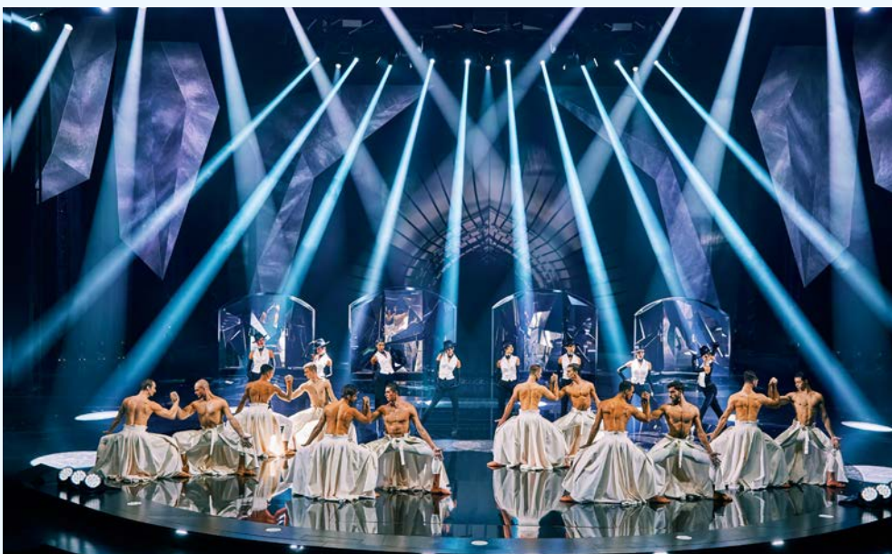
Grandiose Show – die Grand Show VIVID im Friedrichstadt-Palast

Reisepreise pro Person: im Doppelzimmer € 599,- im Doppelzimmer € 679,- zur Alleinbenutzung