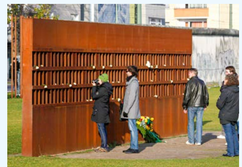
Am Fenster des Gedenkens