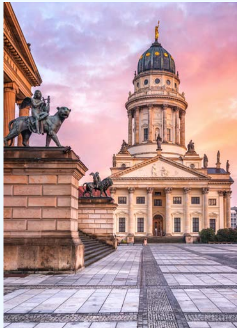
Französischer Dom am Gendarmenmarkt

Taxi-Service (falls gebucht) und bequeme Busfahrt mit Frühstück und Begrüßungssekt von Hannover (Raststätte Lehrter See) nach Berlin. „Mit Mauer/ ohne Mauer – (M)ein Leben“. Eine heitere und