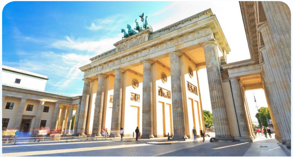
Einst Symbol der Teilung, nun Ort der Zusammenkunft – das Brandenburger Tor am Pariser Platz