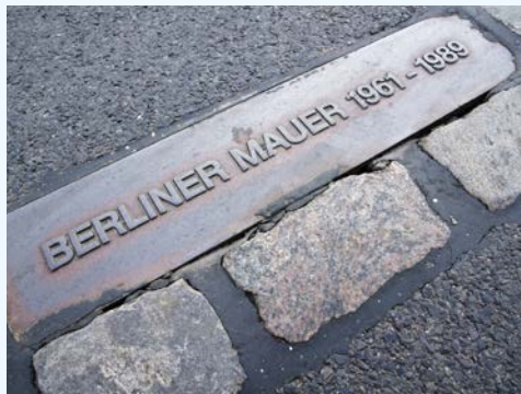
Erinnerungen an die Mauer finden Sie noch überall in Berlin

DDR-Oppositionelle, Fluchthelfer, politische Gefangene – sie alle kennen das ehemalige Stasi-Gefängnis. Heute erinnert die Gedenkstätte an ihre Geschichte. In der Regel führen ehemalige Häftlinge durch das Gefängnis und informieren die Besucher über Haftbedingungen und Verhörmethoden des Staatssicherheitsdienstes.