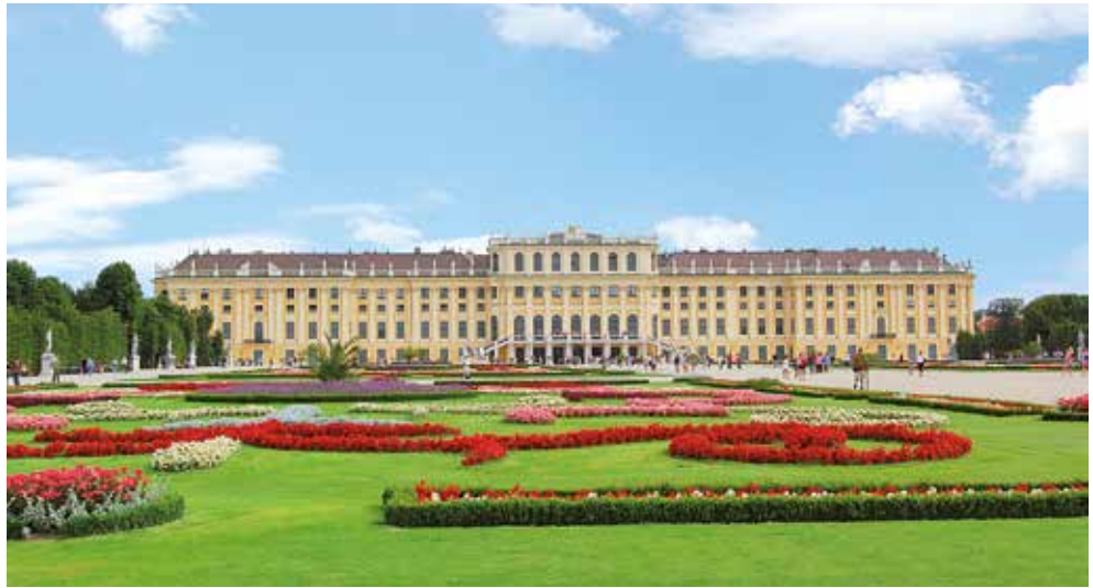
Schloss Schönbrunn in Wien wird Sie begeistern

Die Donau, der zweitlängste Strom Europas, wird nicht ohne Grund als „Königin der Flüsse“ bezeichnet: Von den steinzeitlichen Jägern über die römische Herrschaft bis hin zur k.u.k.- Monarchie – sie alle haben hier ihre Spuren hinterlassen. Ein weiteres Merkmal der Donau: sie verbindet. Hier treffen Kulturen, Religionen und Lebensweisen aufeinander. Die Donau ist ein Stück Deutschland, Österreich, Ungarn und doch noch so viel mehr. Besonderes Highlight dieser Reise ist die Fahrt ins Donaudelta. Das Naturschutzgebiet, welches auch in die Liste des UNESCO-Weltnaturerbe aufgenommen wurde, weist eine einzigartige Vielfalt an Pflanzen und Tieren auf. Freuen Sie sich auf eine unvergleichliche Landschaft, die Sie von Bord des beliebten Premium-Schiffes VistaFidelio aus genießen können.