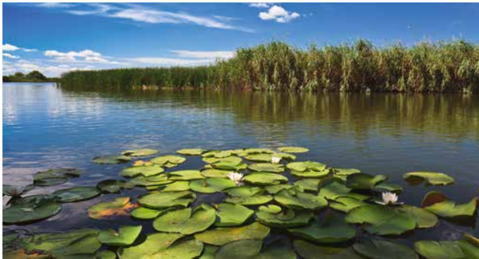
Freuen Sie sich auf die Idylle im Donaudelta!

durchziehen die Stadt. Gerade in den alten Stadtteilen ist das Boot bis heute das Hauptverkehrsmittel.