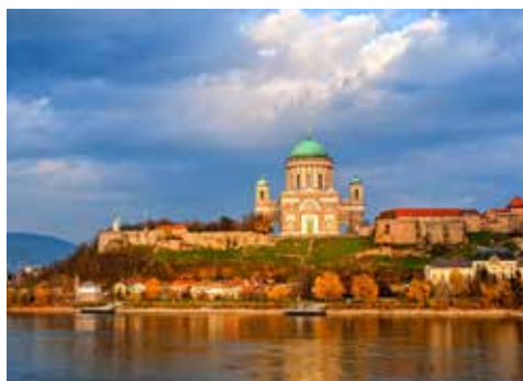
Esztergom am Donauknie ist schon von weitem zu sehen

Das malerische Budapest, auch „Königin der Donau“ genannt, ist eine Stadt voller Lebensfreude. Die Donaumetropole entstand 1873 aus den Stadtteilen Buda und Pest. Die prachtvollen Bauwerke wie das Parlamentsgebäude, der Burgbezirk, die Kettenbrücke und die Fischerbastei prägen das unverwechselbare Stadtbild. Ein Ausflug in die typische ungarische Puszta mit einer Reitervorführung könnte ebenfalls auf Ihrem Programm stehen und ist ein einmaliges Erlebnis.