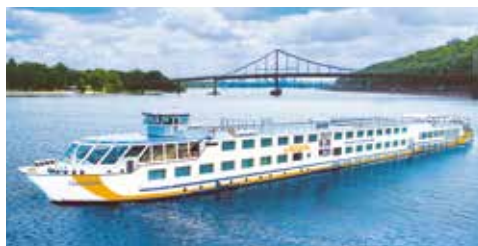
Willkommen an Bord

Vielleicht mit einem leckeren Marillenlikör als Souvenir in der Tasche, treten Sie von Passau die Busfahrt an.