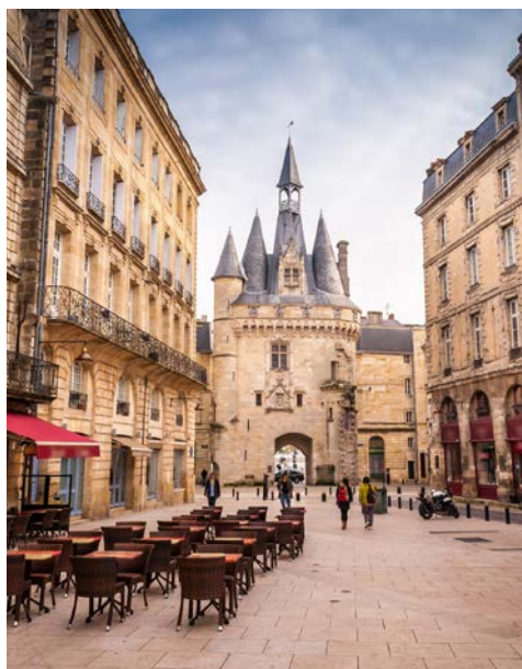
In der Altstadt von Bordeaux

Der heutige geführte Stadtspaziergang, der an Ihrem Hotel startet, führt zu den wichtigsten Sehenswürdigkeiten der Stadt. Die prunkvollen Häuserfronten der ehemaligen Handelskontore „Quartier des Chartrons“, deren Weinkeller direkt auf den Hafen gingen, sind ein beeindruckendes Beispiel für eine gelungene Sanierung. Ohne Zweifel ist die Umgestaltung der ehemaligen Hafenanlagen am Ufer der