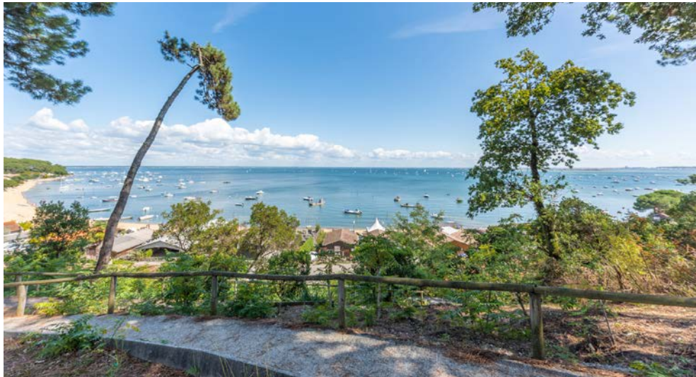
Blick vom Cap Ferret auf die Bucht von Arcachon