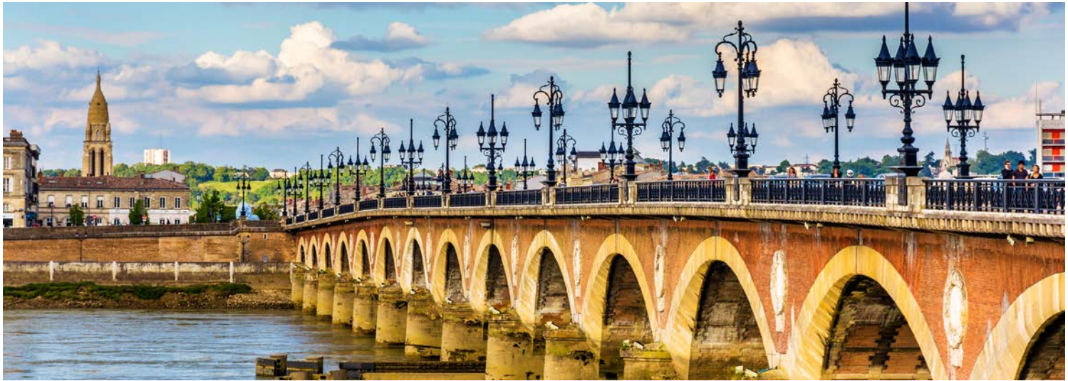
Blick über die Garonne in Bordeaux