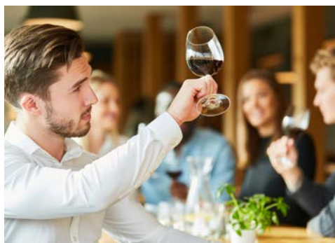
Freuen Sie sich auf Weinproben