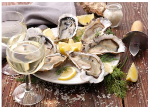
Genießen Sie fangfrische Austern

Das wohl berühmteste Weinanbaugebiet der Welt befindet sich auf der dreiecksförmigen Halbinsel nördlich von Bordeaux, zwischen Atlantikküste, dem Mündungsarm der Gironde und dem Meeresbecken von Arcachon. Der nahe Atlantik sorgt für ein mildes, ausgeglichenes Klima ohne extreme Temperaturschwankungen. Weinanbau auf relativ flachem Gelände, kaum mehr als einen Meter hoch wachsen die Reben. Pittoreske Dörfer und berühmte Weingüter erstrecken sich bis zur Küste. Namen wie Mouton-Rothschild und Pichon-Longueville-Baron, beide in Pauillac angesiedelt, lassen das Herz eines jeden Weinkenners höher schlagen lassen. Bei einer Weinkellerbesichtigung in der Domaine Château Pontac-Lynch in Margaux erfahren Sie viel Wissenswertes über die besonderen Weine und genießen auch den einen und anderen Tropfen. Bevor der bekannte Küstenort Cap Ferret erkundet wird, besuchen Sie die Austernfischer von Arcachon. Mit einer Pinasse, dem flachen Boot der Fischer, fahren Sie zu den großen Austernbänken. Wer möchte, probiert gleich an Bord die frischen Austern. Kilometerlange Sandstrände und eine herrliche Dünenlandschaft zeichnen den Küstenabschnitt Côte d'Argent aus. Bevor Sie das gemeinsame Abendessen in einem Restaurant im mondänen Badeort einnehmen, bleibt Ihnen noch etwas Zeit für eigene Erkundungen. Zurück in Bordeaux sind Sie am späteren Abend.