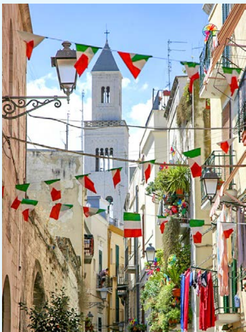
Altstadt von Bari

Der heutige Ausflug bringt Sie in den „Stiefelabsatz“ Italiens in den Salento. Lernen Sie auf einem geführten Rundgang die Provinzhauptstadt Lecce kennen. Erleben Sie den „Lecceser Barock“, der auf die Kunstfertigkeit der Einwohner und ihres besonderen Kalksteins zurückgeht, wodurch die Stadt auch als „Barockmetropole des Südens“ bezeichnet wird. Nach einer Mittagspause, fahren Sie weiter in das Küstenstädtchen Otranto, am östlichen Rand der italienischen Halbinsel gelegen, wo das Adriatische Meer endet und das Ionische Meer beginnt. In der Kathedrale Santa Maria Assunta besichtigen Sie ein Juwel der Mosaikkunst, das komplett erhaltene Fußbodenmosaik, ein gigantisches Werk von 50 m Länge. Diesen eindrucksvollen Tag rundet ein gemeinsames Abendessen ab.