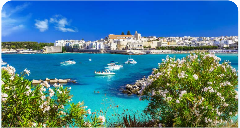
Das Künstlerstädtchen Otranto – malerisch gelegen

entdecken Sie den italienischen Stiefelabsatz, wo die abendländische Kultur mitgeprägt wurde. Trullispitzen ragen in den blauen Himmel, großartige Stauferburgen, romanische Kathedralen und byzantinische Felsenkirchen, Kunst- und Kulturschätze zeugen von einer Vergangenheit verschiedener Kulturen. Sanfte, weite Sandstrände, schroffe, karge Gebirge und die typisch rote Erde der Murgia mit ihren unendlich weiten Olivenhainen lassen Sie eine einzigartige Landschaft erleben. Spazieren Sie durch das Trullidorf Alberobello mit seinen einzigartigen Häusern, erleben Sie die „Weiße Stadt“ Ostuni und lassen Sie sich beeindrucken von der monumentalen Architektur sowie der mystischen Wirkung der Stauferburg Castel del Monte.