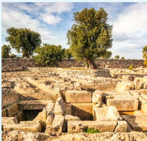
Grabungsstätten von Egnazia

Heute unternehmen Sie einen Ausflug in die Region Basilikata, außerhalb Apuliens gelegen, zur Höhlenstadt Matera, die seit 1993 zum Welterbe der Menschheit zählt. Erfahren Sie auf einem geführten Spaziergang durch den Ort mehr über die seit vorgeschichtlichen Zeiten in den Kalktuff gehauenen Behausungen. Erleben Sie das „Wohngefühl“ einer Höhlenwohnung, die Schutz vor Hitze und Feinden bot, sowie die spezielle Atmosphäre einer Grottenkirche. Ein gemeinsames Abendessen beschließt diesen beeindruckenden Tag.