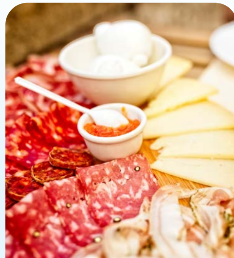
Köstlichkeiten der Region