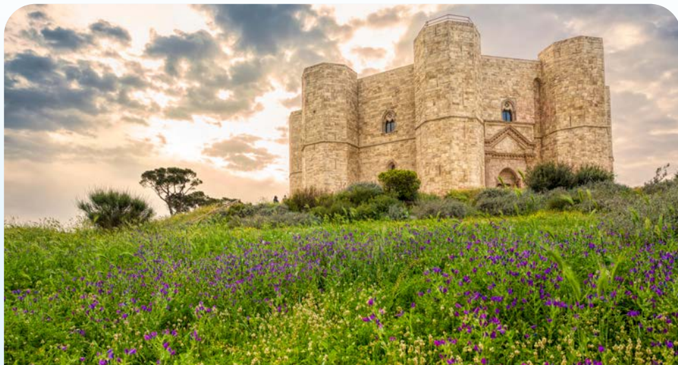
Faszinierend symmetrisch – Castel del Monte