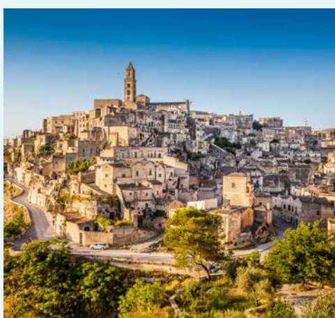
Beeindruckende Höhlenstadt Matera