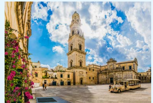
Barocke Pracht in Lecce

auf einem geführten Rundgang das Trulli-Dorf Alberobello, dessen Gassen von den berühmten Steinhäuschen mit einer kegelförmigen Kragkuppel gesäumt werden. Nach einer Mittagspause fahren Sie weiter zu den Grotten von Castellana, einer gigantischen Tropfsteinhöhle mit Grotten, die eine Höhe von 40 m aufweisen. Entdecken Sie auf einer Führung dieses unterirdische Labyrinth. Zum Abschluss des Tages besuchen Sie die „weiße Stadt“ Ostuni, dessen weiß getünchte Häuser sich am Hang des Hügels übereinander staffeln, und somit schon von weitem leuchten. Am Abend erwartet Sie ein gemeinsames Abendessen.