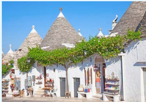
Trulli-Häuser in Alberobello

Erleben Sie auf ihrem heutigen Ausflug (falls gebucht) die Landschaft des Valle d'Itria. Das Landschaftsbild wird von den sehr typischen Steinhäusern, den Trulli, geprägt. Erkunden Sie