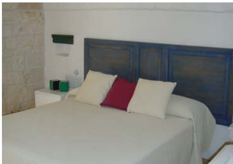
... komfortable Zimmer, ...