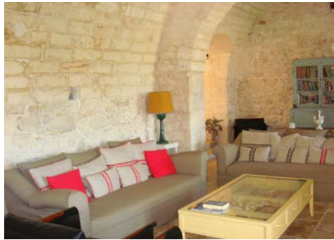
... gemütliche Ecken drinnen ...