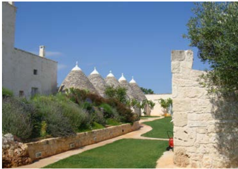
Ihre Hotelanlage bezaubert ...