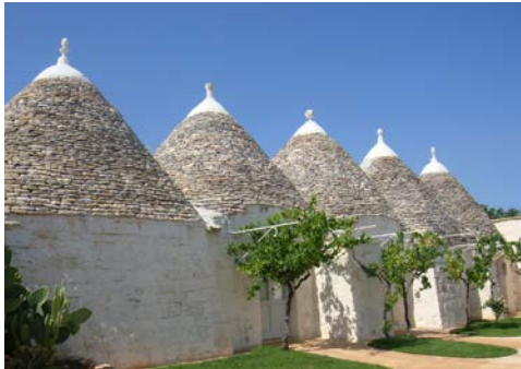
... durch ihre Trulli-Bauten und bietet ...