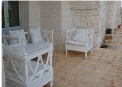
... und draußen für entspannte Gespräche ...