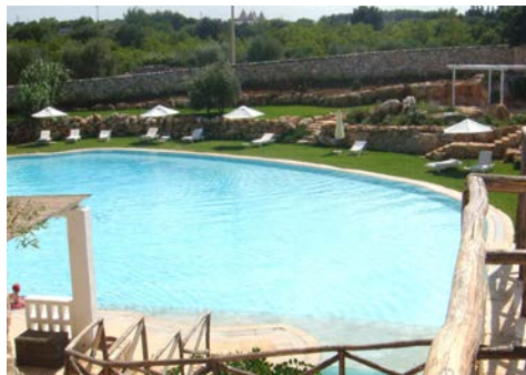
... und einen Pool für ein erfrischendes Bad.